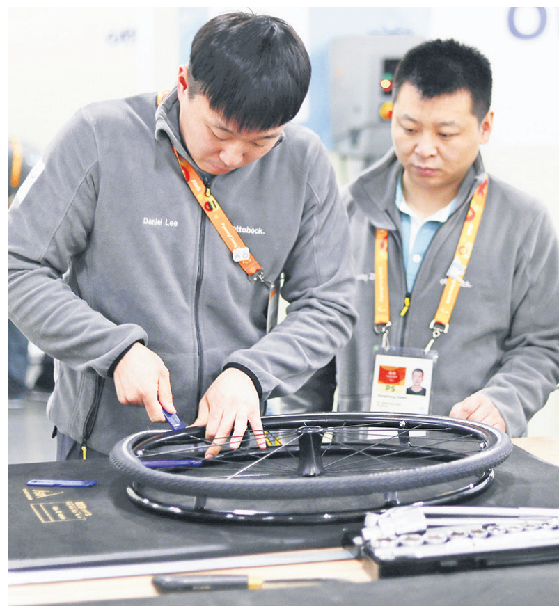
Die technischen Experten der Ottobock-Werkstatt kümmern sich auch um die Alltags-Hilfsmittel der Athleten. Hier wird der Reifen eines Rollstuhls gewechselt, bei den Paralympics in Pyeong Chang 2018.