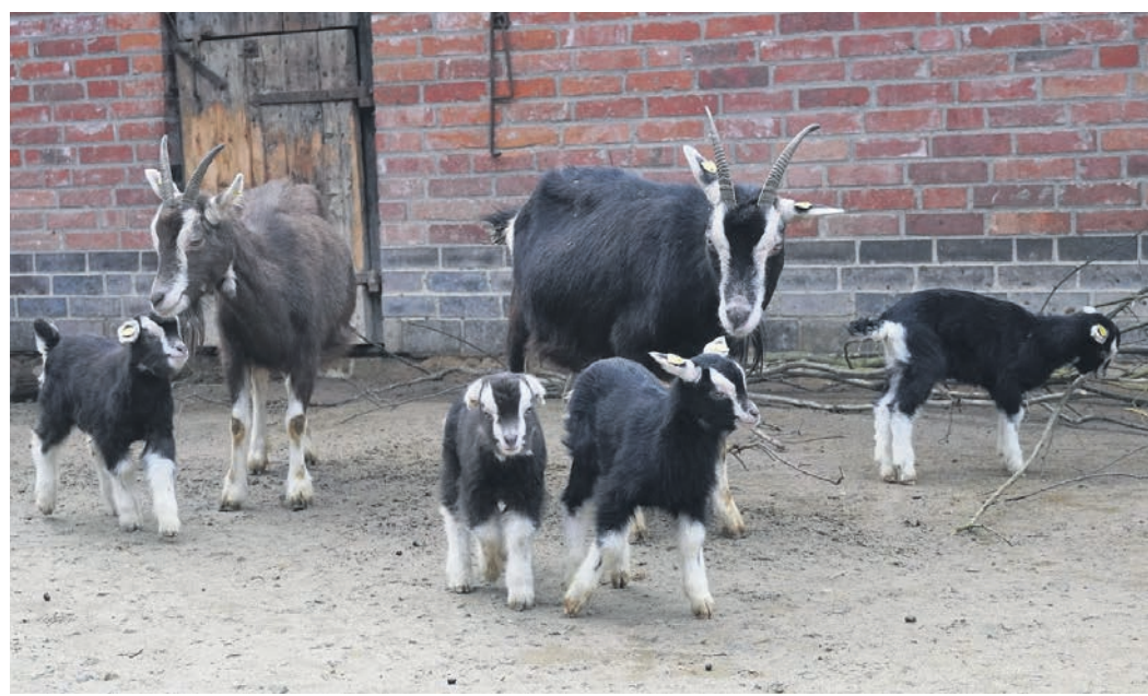
Die vier kleinen und neugierigen Thüringer Waldzicklein gehen auf Meyers Hof gemeinsam mit ihren Eltern auf Entdeckungstour.

Für einen Besuch im Erlebnis-Zoo Hannover gilt für den gesamten Bereich die 2G-Regel. Der Zutritt ist für vollständig Genesene oder vollständig Geimpfte möglich. Bitte einen entsprechenden Nachweis be-