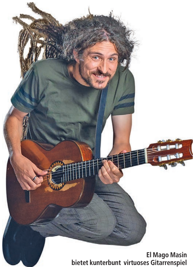
El Mago Masin bietet kunterbunt virtuoses Gitarrenspiel und wahnwitzige Lieder.