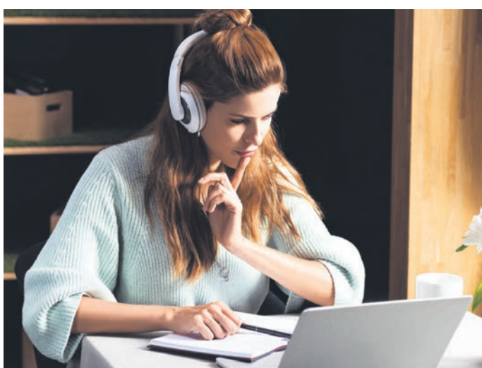
Die Universität Göttingen präsentiert am 14. und 15. März digital das Studienangebot in über 50 Live-Vorträgen.

Tipps zu Vor- und Nachbereitung der Informationstage für Schulklassen, Lehrkräfte und Einzelpersonen, einen Überblick über das Programm und die einzelnen Studienfächer sowie die Links zu den einzelnen Vorträgen sind im Internet unter www.uni-goettingen.de/informationstage zu finden. PUG