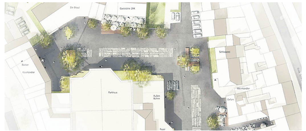
Der Siegerentwurf für den Wochenmarktplatz.

Für den Umbau fließen reichlich Fördergelder, der städtische Eigenanteil beträgt zehn Prozent. Die Kosten betragen etwa zwei Millionen Euro inklusive der Erneuerung von Schmutz- und Regenwasserkanälen durch die Göttinger Entsorgungsbetriebe. Fünf Büros waren damit beauftragt gewesen, Entwürfe für einen Wochenmarktplatzgestaltung zu entwickeln. Unter Beteiligung von Bürgern, Anwohnern sowie ansässiger Betriebe und Einrichtungen wurden die Entwürfe weiterentwickelt und abschließend noch einmal öffentlich präsentiert. Nach einer intensiven Diskussion hat sich