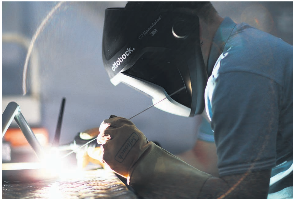
SchweißerInnen, OrthopädietechnikerInnen und RollstuhlspezialistenInnen aus 12 Ländern gehören zum Werkstatt-Team von Ottobock in „Beijing 2022“. Dank dem kostenlosen technischen Service, können sich die AthletInnen ganz auf ihre sportliche Performance konzentrieren.

Dort können die Paralympioniken ihre Ausrüstung vor und während der Wettkämpfe kostenfrei warten und reparieren lassen. Denn das Equipment, zum Beispiel für Para-Snowboard, -Biathlon oder -Eishockey, ist extremen Belastungen ausgesetzt. Die 40 technischen Experten der Ottobock Werkstätten sorgen auch dafür, dass die Alltags-Hilfsmittel gut in Schuss sind, etwa Rollstühle, Prothesen und Orthesen. So schaffen sie die technischen Voraussetzungen dafür, dass sich die Athleten voll auf ihre Leistung und den Wettkampf konzentrieren können.