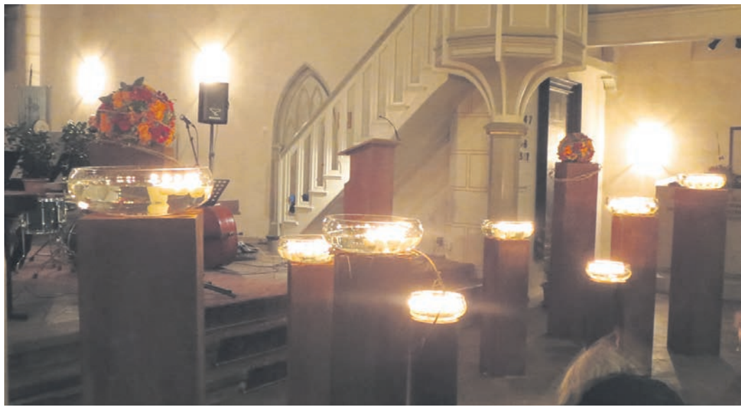
Das Entzünden der Kerzen steht im Mittelpunkt des Festes der Erinnerung.

ein aufwendiges Programmheft wird es am 16. November nicht geben. Beginn der Veranstaltung in der Albanikirche ist um 19 Uhr. Das Konzept des Festes der Erinnerung bleibt bestehen. Benstem wird die Besucher begrüßen. Im Anschluss gibt es im Wechsel Musik und Lesungen: Texte, die der 48-Jährige und der Pastor vortragen. Im Mittelpunkt der Veranstaltung „kommen die Besucher nach vorne und zünden Kerzen an“, sagt Benstem, Mitinhaber des Göttinger Bestattungshauses in der Roten Straße 32. Sie versammeln sich in Gedanken an die Gestorbenen. Im Anschluss singen sie das Lied „Von guten Mächten wunderbar gebor-