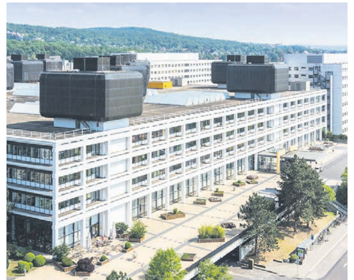
Die Universitätsmedizin Göttingen.