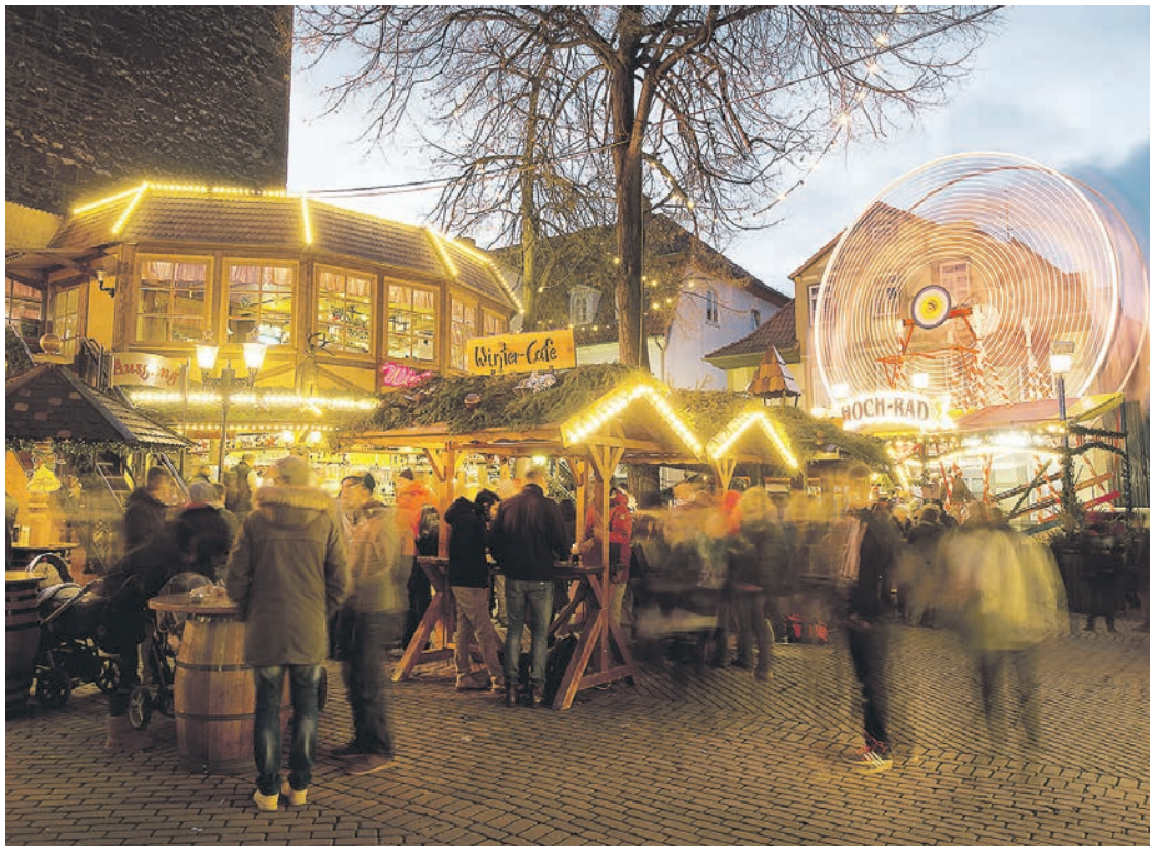
Unterhaltung in den Wochen vor dem Fest soll der Treffpunkt Weihnachtsmarkt Besucherinnen und Besuchern der City bieten.