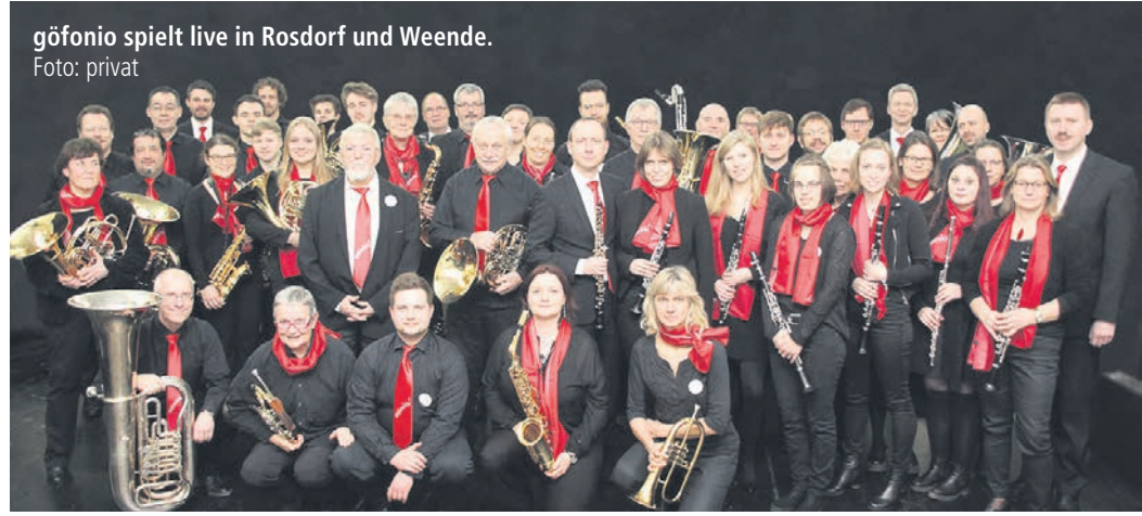
göfonio spielt live in Rosdorf und Weende.

Tickets sind an der Abendkasse oder an folgenden Vorverkaufsstellen erhältlich: Tonkost (Judenstraße 31, Göttingen), Rewe-Markt Rosdorf und „Der Buchladen“ in Rosdorf. Weitere Informationen unter www.goe-fonio.de . SKI