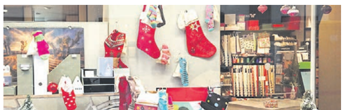
„Nikolaus“-Socken in einem Schaufenster (2021).

nen Jahr wurde erstmalig die Nikolaus-Sockensuche von Pro-City veranstaltet. Aufgrund des Erfolgs, 500 Kinder haben sich beteiligt, so Pro City, wird die Aktion dieses Jahr wiederholt. Ab dem Nikolaustag am 6. Dezember heiße die Devise: „Hol dir deine Socke zurück“ – die jungen Besitzer der Fußwärmer werden sie in den beteiligten Geschäften finden. Wer sie entdeckt hat, zeigt den bei der Abgabe ausgehändigten Coupon vor und erhält die gefüllte Socke zurück. Die Anzahl der Teilnehmer ist auf 500 begrenzt. SKI