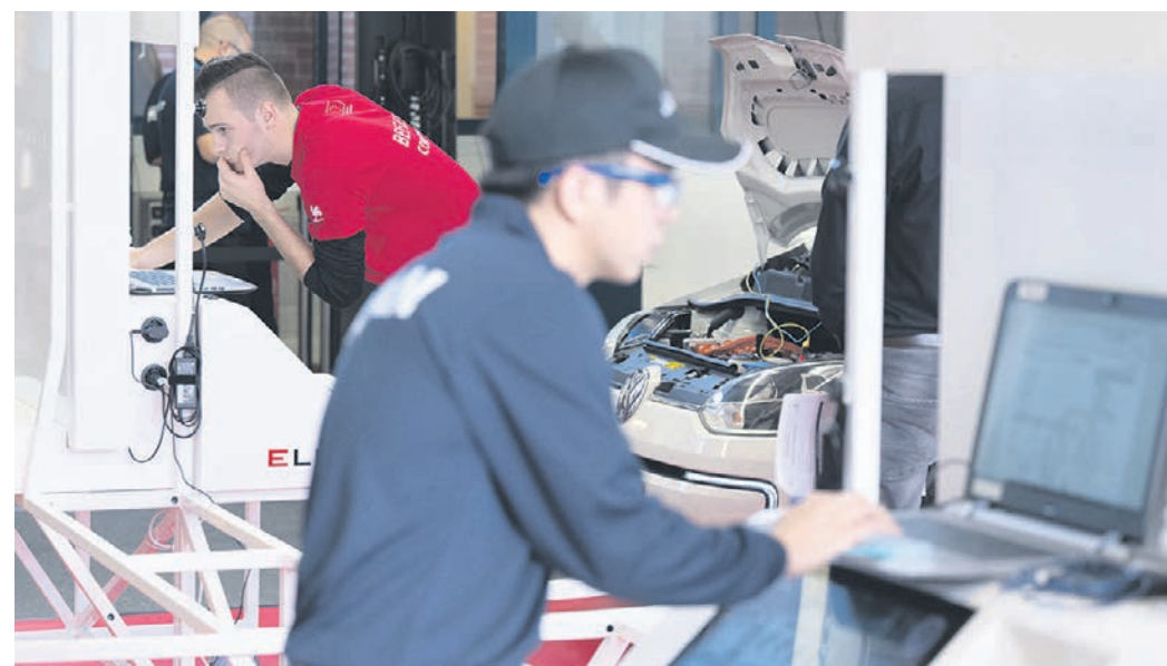
Kfz-Mechatroniker arbeiten an einem Laptop.