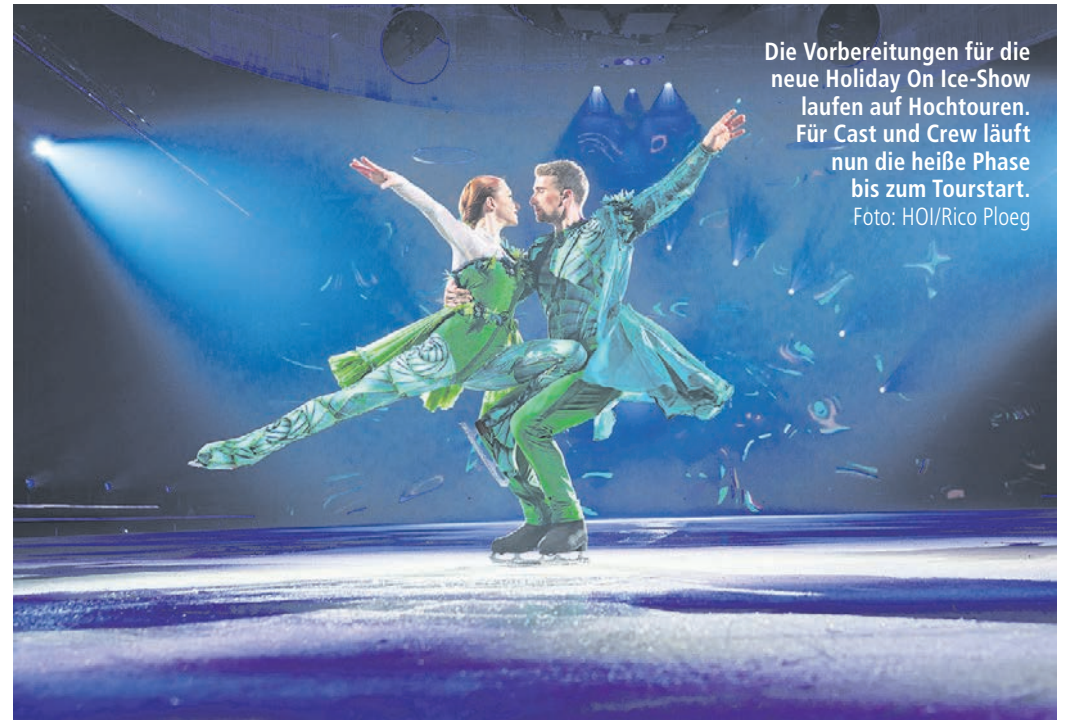
Die Vorbereitungen für die neue Holiday On Ice-Show laufen auf Hochtouren. Für Cast und Crew läuft nun die heiße Phase bis zum Tourstart.

Tipp für Familien: Holiday On Ice bietet Kindern im Alter von vier bis 15 Jahren einen Kinderfestpreis. Unabhängig von der Ticket-Kategorie der begleitenden Erwachsenen bleibt der Preis für die Kinder-Karten immer derselbe. STAR