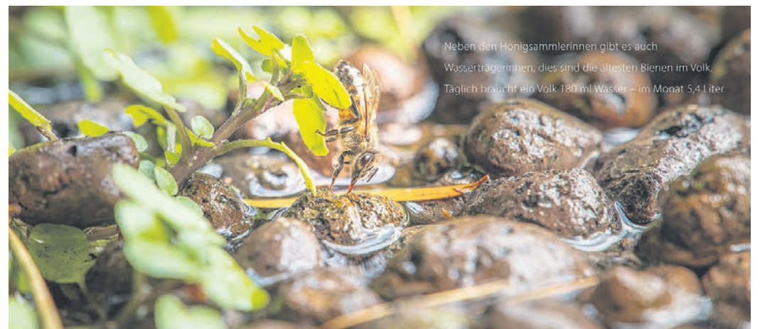
Neben den Honigsammlerinnen gibt es auch Wasserträgerinnen, dies sind die ältesten Bienen im Volk. Täglich braucht ein Volk 180 ml Wasser – im Monat 5,4 Liter.

Kaufen kann man den Bienen-Kalender in Göttingen bei Thalia in der Weender Straße, bei Hugendubel in der Weender