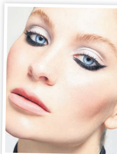
Reverse Cat Eyes haben die sozialen Medien im Sturm erobert.

Auffälliger ist der „Reverse Cat Eye-Look“, der die sozialen Medien im Sturm erobert hat. Der dunkle Kajalstrich wird dabei nicht auf dem Lid, sondern am unteren Wimpernkranz aufge-