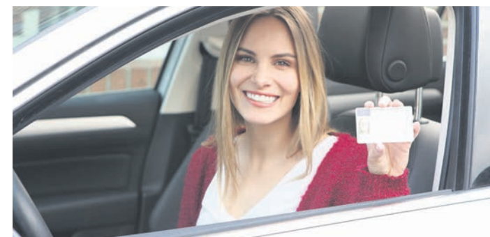
So sehen die neuen Führerscheine aus.

behörde der Stadt Göttingen 1953 geboren sind, müssen ihren Führerschein derzeit nicht tauschen.