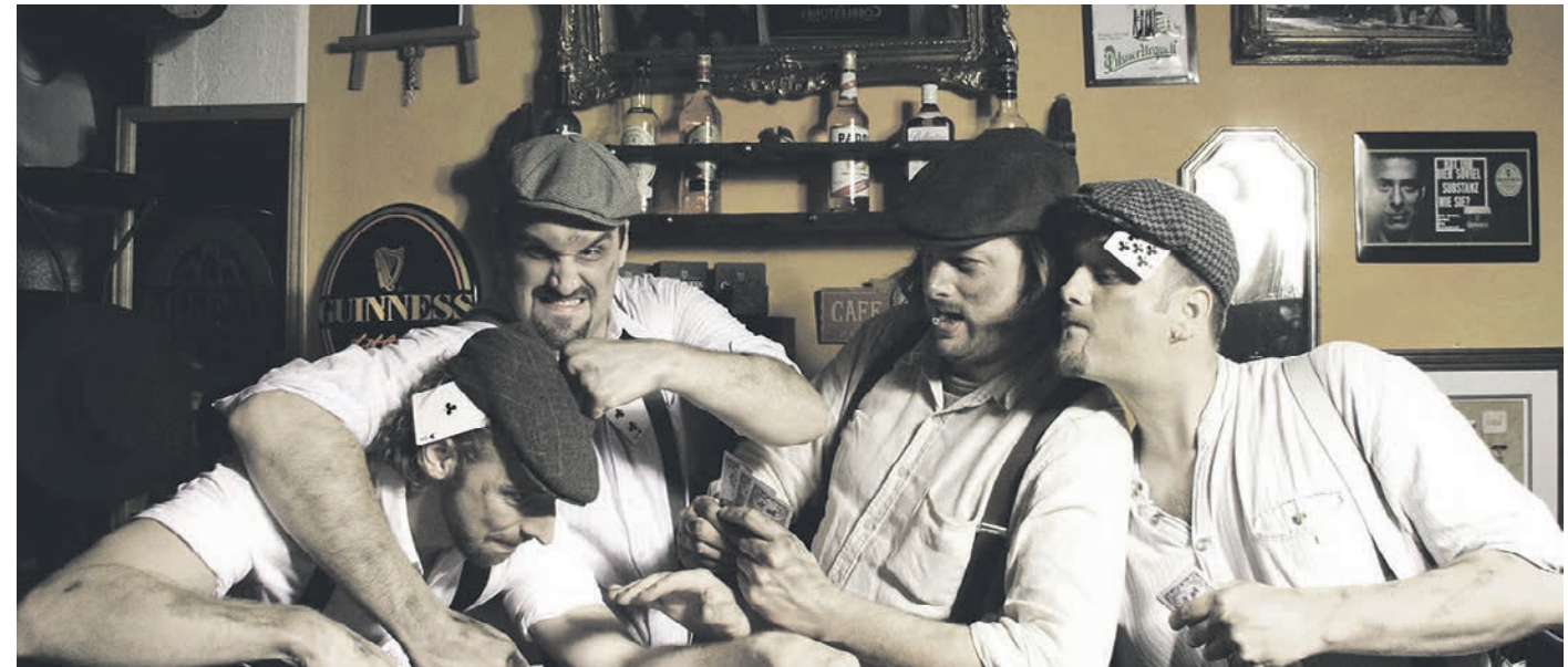
Kultur im Kreis: Am Sonntag gibt es Irish Folk mit den Cobblestones im Brotmuseum Ebergötzen.

13.00 PS Speicher Einbeck: Führung durch die Sonderausstellung „Klein aber mein“, 14.00 Zeitreisen durch die Geschichte der Mobilität (Führung)