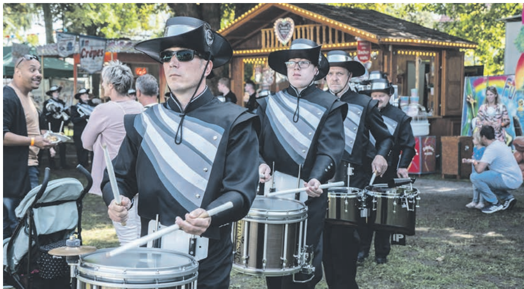
Nach dem großen Festumzug gibt es auch in diesem Jahr ein Konzert der Musikzüge im Festzelt.

Mit einem bunten Kindernachmittag wird in den Kirmessamstag gestartet. Der Allgemeine Rettungsverband ist nicht „nur“ zum Helfen vor Ort, das Team