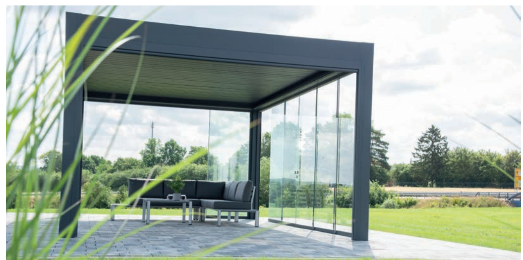
Auf dem Firmengelände kann man den Q.bus besichtigen – ein Lieblingsplatz für jeden Garten.

„Mein Ziel ist es, in fünf Jahren das Unternehmen so weiter auszubauen, dass wir mit unseren vielen Alleinstellungsmerkmalen noch erfolgreicher sein können“, sagt der Firmenchef, dessen Unternehmen sich sowohl bei den Duderstädter Sportlern als auch bei der BG Göttingen engagiert. „Ich bin da sehr optimistisch, dass wir dieses neue Ziel auch erreichen können.“