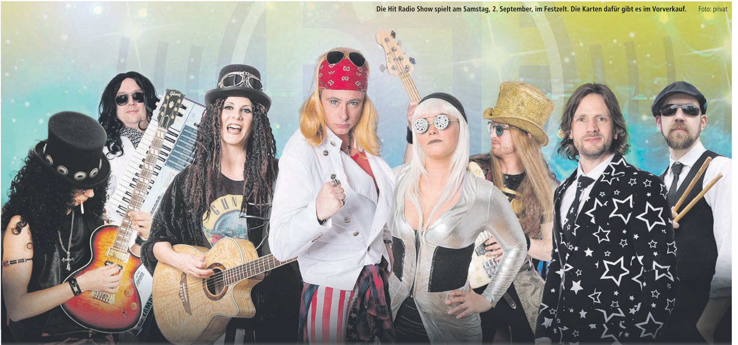
Die Hit Radio Show spielt am Samstag, 2. September, im Festzelt. Die Karten dafür gibt es im Vorverkauf.