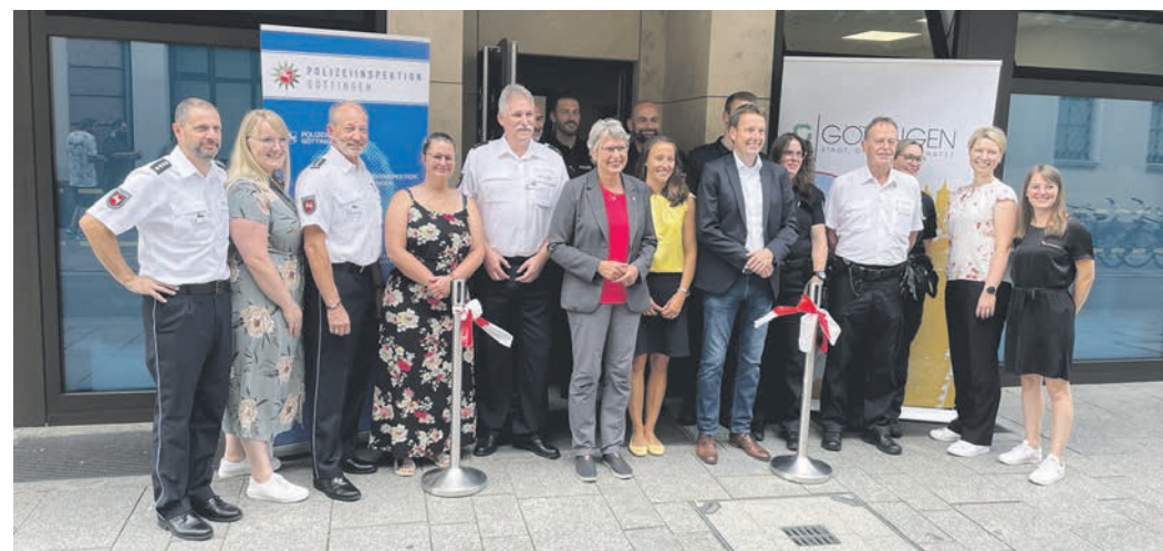
Im Haus Stumpfbiel 7 ist in dieser Woche die neue Innenstadtwache für Polizei und Stadtordnungsdienst eröffnet worden.

Vor allem aber die Präsenz in der Innenstadt sei besonders wichtig. Die Menschen sollten zu ihnen kommen, um gefundene Brieftaschen abgeben zu können, über Orte zu berichten, an denen gerade gedealt werde, sich über zu laute Musik aus Ghettablastern zu beschweren, laut Reuter ein übliches Problem in der Fußgängerzone. Alltägliche Sorgen sollten in der Innenstadtwache besprochen werden können. PEK