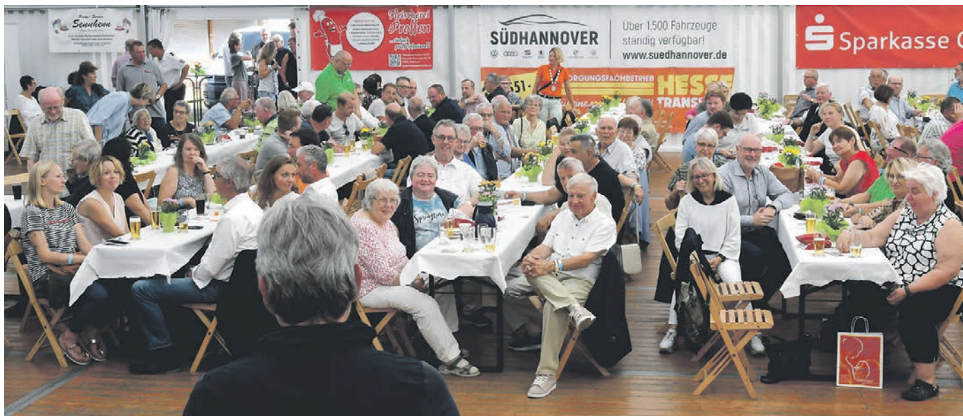
Das traditionelle Kirmesfrühstück steht natürlich auch 2023 wieder auf dem Programm.

Im Rahmen des Frühstücks werden die schönsten Wagen und Fußgruppen des großen Festzugs prämiert. Mit dem Wegbringen der Schützenkönige klingt die Kirmes dann so langsam, aber sicher aus – bis in den späten Nachmittag hinein kann man sich aber noch auf dem Festplatz treffen und vergnügen. STAR