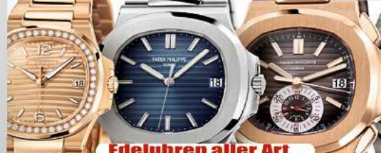
Edeluhren aller Art

Ihre Vorteile: ✓ kostenlose Beratung ✓ kostenlose Wertschätzung ✓ transparente Abwicklung ✓ Bargeld sofort