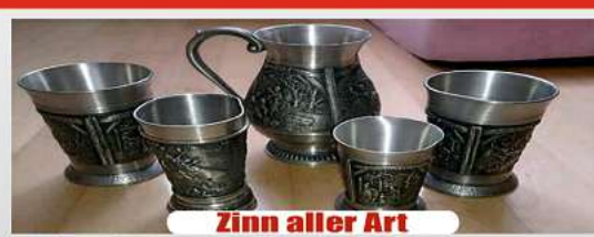
Zinn aller Art