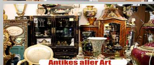
Antikes aller Art

Wir zahlen zur Zeit bis zu 64,50 * *Euro pro Gramm SOFORT BARGELD