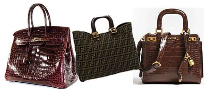
Wir kaufen auch hochwertige Markentaschen an

Die Experten sind für Sie da 6 Tage Aktion