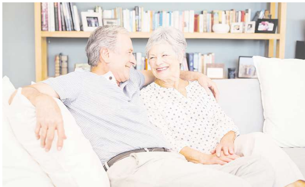
Wenn sich Wohnbedürfnisse ändern, hilft die Wohnraumagentur bei der Planung.

Mitarbeiterin der Wohnraumagentur, sieht vor allem bei den in die Jahre gekommenen Einfamilienhäusern ein sehr großes Potenzial, den Bestand effizienter zu nutzen. „Mit dem Umbau des Hauses kann der eigene Wohnraum an neue Bedürfnisse angepasst und gleichzeitig Wohnraum für andere geschaffen werden. Wir wollen