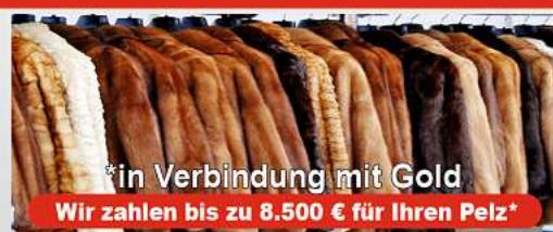
*in Verbindung mit Gold Wir zahlen bis zu 8.500 € für Ihren Pelz*