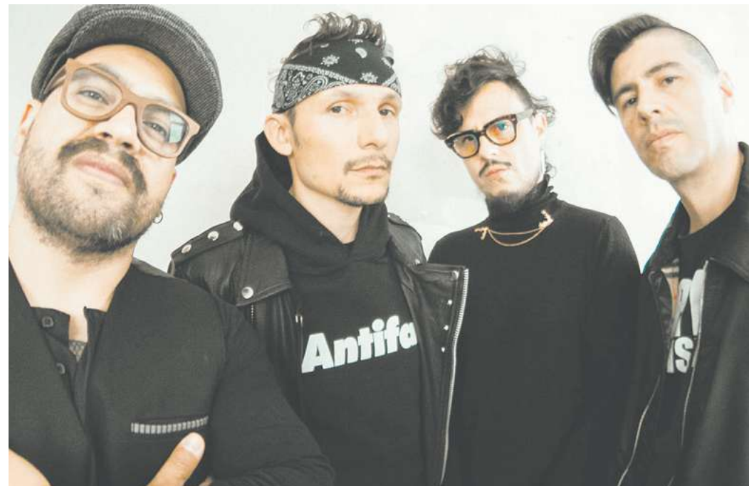
Die Ska-Rocker von Doctor Krapula stellen auf ihrer Winter-Tour 2024 ihr neues Album „Arte es resistencia“ vor – am Freitag in der Musa in Göttingen.

Live-Musik/Party 15.30 Wohnstift Göttingen: Tárrega und die Geburt der modernen Gitarre mit Negin Habibi 19.00 Exil: Swing-a-round (Lindy Hop, Swing, Charleston und Boogie)