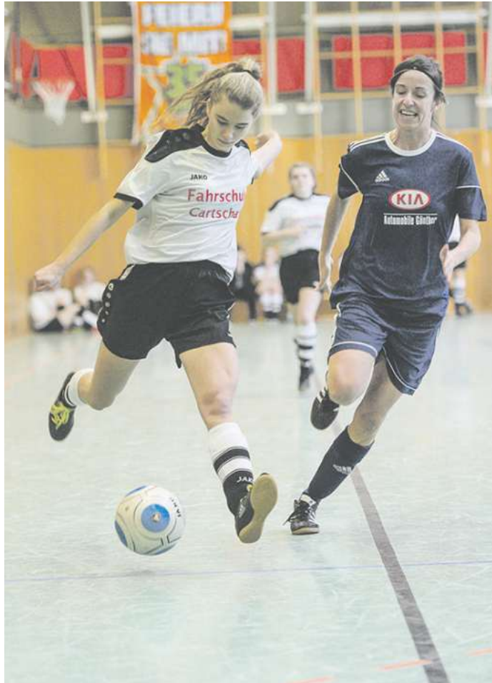
Heute gibt es in der Adelebser Sporthalle beim Spedition-Krüger-Frauencup wieder spannende Spiele zu sehen.