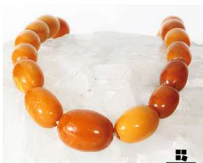
Bernstein aller Art