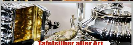
Tafelsilber aller Art