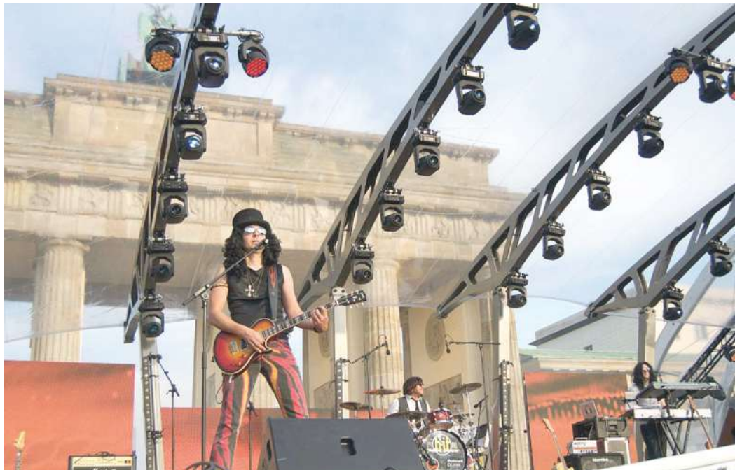
Vor zehn Jahren; Eine Riesen-Bühne vor einem Riesen-Publikum am Brandenburger Tor.

Das erste Konzert fand in Soltau zum Tanz in den Mai im Jahr 2000 statt. „Die Band zog sich schräge Klamotten an. Die zwei Sängerinnen und zwei Sänger wechselten ständig hinter der Bühne ihre Outfits und Perücken, kamen jedesmal als ein anderer Star auf die Bühne. Das Publikum war völlig aus dem Häuschen, damit hatte niemand gerechnet“, erinnert sich Danneboom daran, dass gleich der erste Auftritt ein voller Erfolg