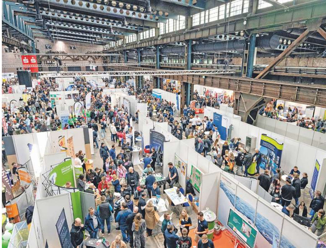
Auch in diesem Jahr werden wieder Tausende Besucher beim GöBIT erwartet. Die Türen sind von 10 bis 15 Uhr geöffnet.

Doch auch für Schülerinnen und Schüler jüngerer Jahrgänge lohnt sich ein frühzeitiger Besuch, denn bei der Berufswahl sind Informationen das A und O. Und je früher das Thema angepackt wird, desto besser kann die Berufswahlentscheidung abgesichert werden. Damit die Besucherinnen und Besucher in Sachen Berufswahl nichts dem Zufall überlassen müssen, haben sich die Unternehmen, Bildungsträger und Institutionen darauf vorbereitet, möglichst alle Fragen beantworten