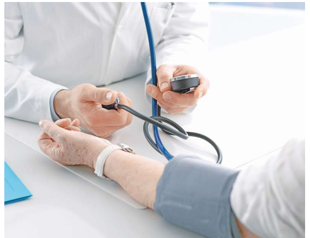
Physician Assistants sollen die Hausärzte bei ihrer täglichen Arbeit mehr unterstützen – zum Beispiel bei der Blutdruckkontrolle.

VON DER ADMINISTRATION ENTLASTEN „Wir wollen Hausärztinnen und -ärzten mehr Luft verschaffen, um ihre Patienten zu versorgen. Ärzte sollten nur das machen, wofür ihre Qualifikation tatsächlich benötigt wird. Von anderen medizinischen und administrativen Aufgaben sollten sie