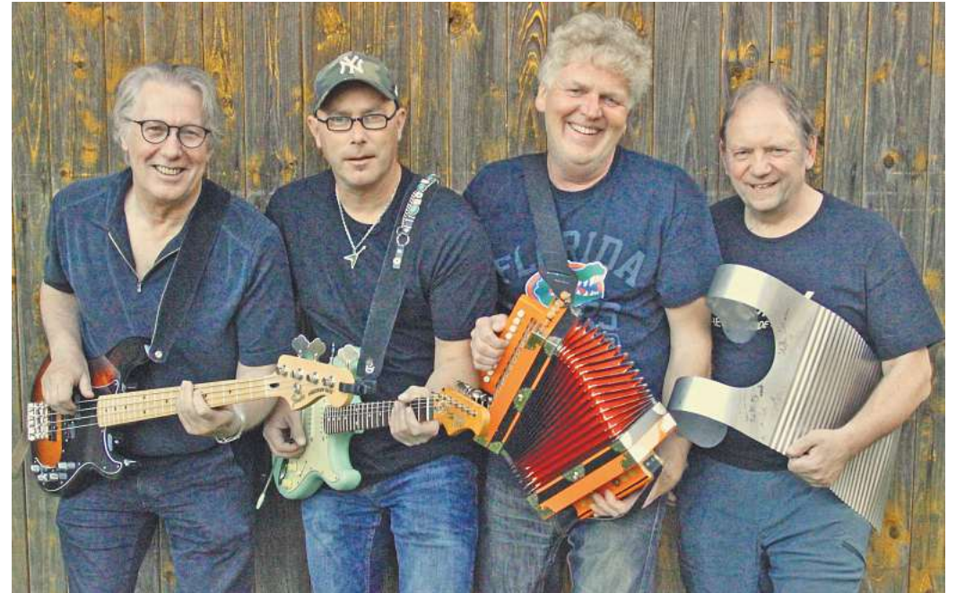
Die Bayou Alligators eröffnen am Mittwoch die Kulturkneipe 2025 in der Historischen Spinnerei Gartetal mit Zydeco, Blues und Roots-Music.