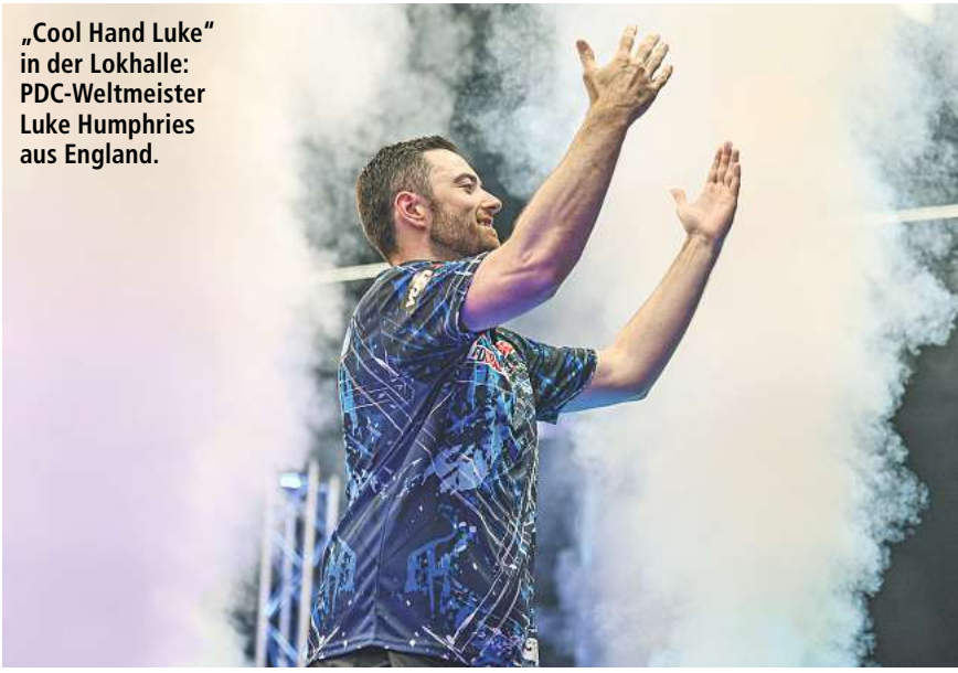
„Cool Hand Luke“ in der Lokhalle: PDC-Weltmeister Luke Humphries aus England.