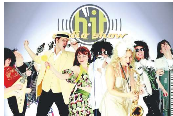
So ging es 2000 los: Das erste Pressefoto.

Die Liste der Stars, mit denen die Hit Radio Show schon auf der Bühne gestanden hat, ist noch länger. Als da wären: David Hasselhoff, David Garrett, Kim Wilde, Loona, The Baseballs, Karat, Gunter Gabriel, Jürgen Drews, Bananarama, Mike Krüger, Shakin' Stevens, De Höhner, DJ Ötzi, Marquess, Dr. Alban, Right Said Fred, Boney M., Hermes House Band, Baccara, Lotto King Karl, Patrick Nuo, Heinz Rudolf Kunze, Purple Schulz, Nino de An-