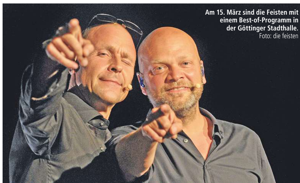
Am 15. März sind die Feisten mit einem Best-of-Programm in der Göttinger Stadthalle.