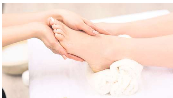
Sorgfältige Anamnese und ein maßgeschneiderter Behandlungsplan sollten Teil der professionellen Fußpflege sein.

individuell angepasste Therapien zunehmend wichtiger werden. „Sorgfältige Anamnese, präzise Befundungen und ein maßgeschneiderter Behandlungsplan sind heute zentral“, so die Spezialistin. „Denn dies trägt zu erfolgreichen Ergebnissen bei, schafft Vertrauen und Zufriedenheit.“ Außerdem zeige sich so die Kompetenz und die Professionalität der Fachkräfte, was von Patientinnen und Patienten enorm wertgeschätzt wird. „Ein weiterer Trend ist die Prävention“, so Geismann. Durch regelmäßige Fußkontrollen wer-