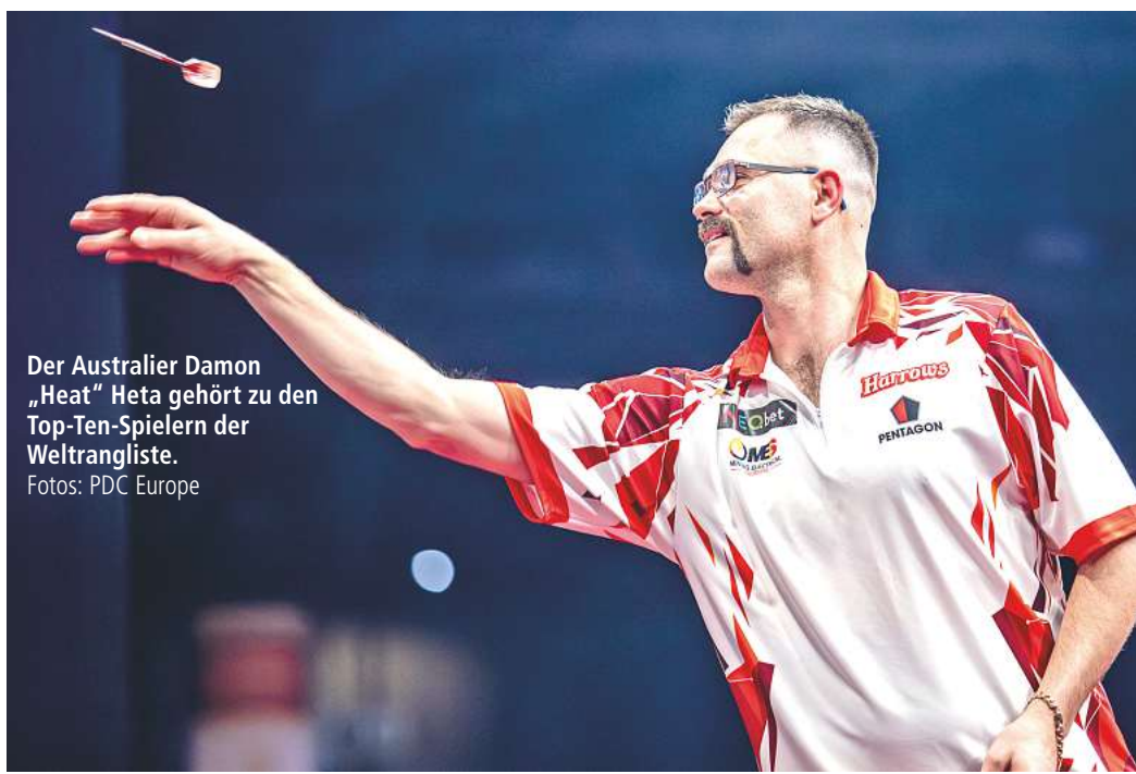
Der Australier Damon „Heat“ Heta gehört zu den Top-Ten-Spielern der Weltrangliste.

Veranstaltet wird das Event von der Professional Darts Corporation (PDC). Weltmeister, Shootingstars und die besten Nachwuchsspieler des Sports kämpfen um den Titel. Mit dabei sind unter anderem die Weltmeister Luke Humphries, Gerwyn Price und Michael van Gerwen sowie die Publikumslieblinge Stephen Bunting, Jonny Clayton und Damon Heta. Die Winamax PDC European Tour ist die größte Darts ProfiTurnierserie in Kontinental-Europa. Bei 14 Turnieren der European Tour in Deutschland, den Niederlanden, Österreich, Belgien, Ungarn, der Schweiz und Tschechien treten die besten Profis im Darts-Sport über jeweils drei Tage in der Arena und für Darts-Fans vor den Bildschirmen gegeneinander an. Dabei spielen die Profis um ih-