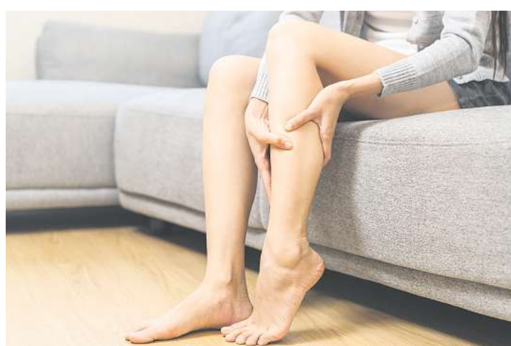
Treten Wadenkrämpfe immer wieder und besonders hartnäckig auf, sollte unbedingt eine ärztliche Abklärung erfolgen.

KG, manuelle Therapie, PNF, Lymphdrainage, Marnitz, Cyriax, Brügger, Kiefergelenksbehandlung, Massage, Wärme- u. Kältetherapie, Hausbesuche, Termine nach Vereinbarung, kostenfreie Parkplätze Unterm Hagen 29, 37079 Göttingen, Tel. 0551-66894