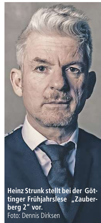
Heinz Strunk stellt bei der Göttinger Frühjahrslese „Zauberberg 2“ vor.

Ich habe mich in meinen Roman noch nie wiederholt, und so soll es auch bleiben.