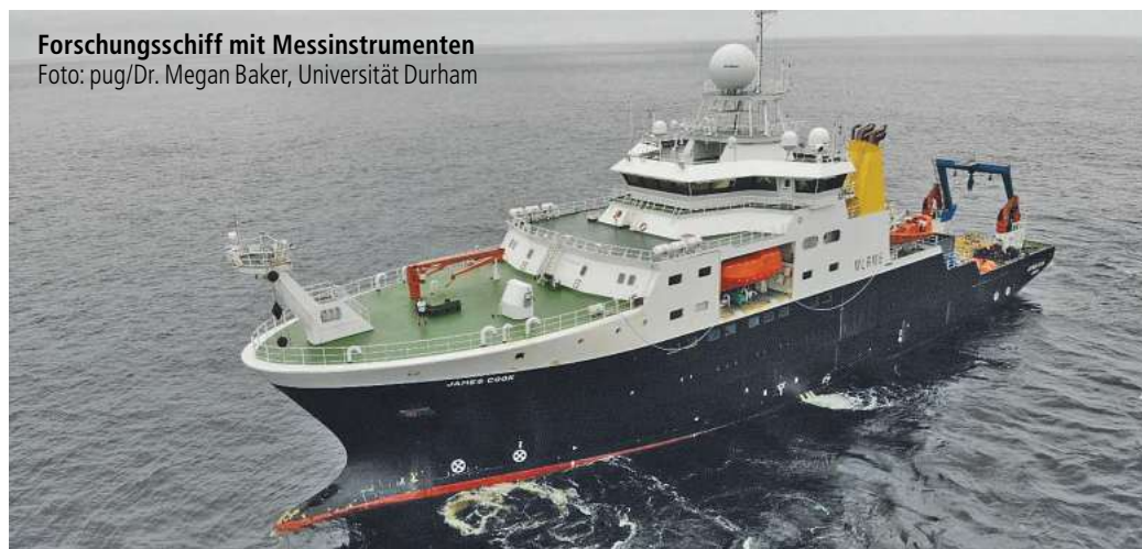
Forschungsschiff mit Messinstrumenten

2019 erstmals ein Dutzend Ozean-Boden-Seismometer (OBS) im Kongo-Canyon vor der Westküste Afrikas. Die Messgeräte erfassen Signale, die von der Oberfläche und dem Meeresboden unseres Planeten ausgehen. Die Forschenden konnten damit in mehreren Kilometern tiefer Entfernung zunächst etliche Einzelströme messen, die schließlich als zwei massive Trübeströme vereint den Kongo-Canyon hinabwälzten. Weiter als 1.000 Kilometer kosteten sie mit einer Geschwindigkeit von 13 bis 27 Kilometern pro Stunde über viele Tage durch die untermeerischen Schluchten. Zusätzlich transportierten sie nicht nur warmes Oberflächenwasser in die Tiefsee, sondern auch große Mengen an Kohlenstoff – fast ein Viertel der Menge, die alle Flüsse der Welt pro Jahr in die Ozeane entlassen.