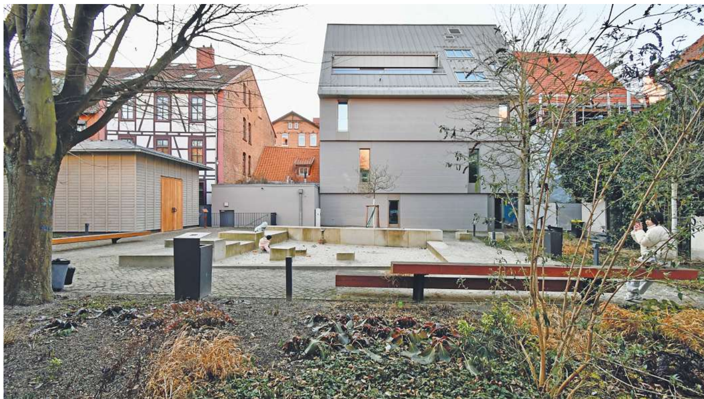
Das Kunsthaus in der Düsternen Straße: Der Innenhof mit dem „House of Words“ (links), einem Pavillon des Künstlers Jim Dine.