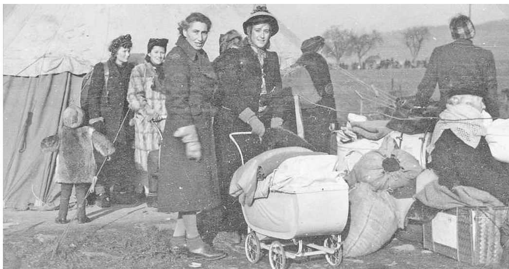
Geflüchtete Frauen während einer Rast neben einem britischen Armeezelt bei Besenhausen.

Das Museum Friedland ist mittwochs bis sonntags zwischen 10 und 18 Uhr geöffnet. Für alle Fragen rund um den Besuch im Museum Friedland ist der Besucherservice telefonisch unter 05504 / 80 56 200 oder per E-Mail unter besuch@museum-friedland.de zu erreichen.