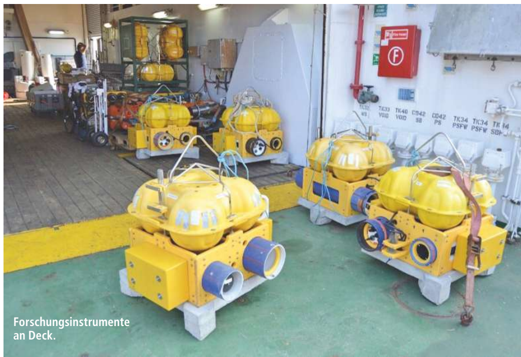
Forschungsinstrumente an Deck.