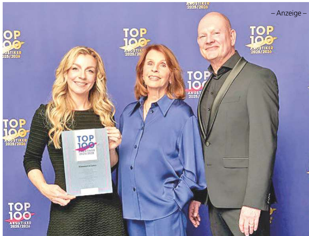
– Anzeige –