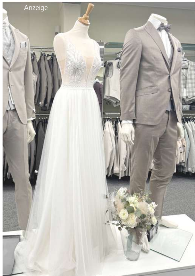
– Anzeige –

Kunden können ab sofort über die Website www.wilvorst-outlet.de exklusive Einzeltermine buchen – für ein persönliches Shopping-Erlebnis in entspannter Atmosphäre außerhalb der Öffnungszeiten.