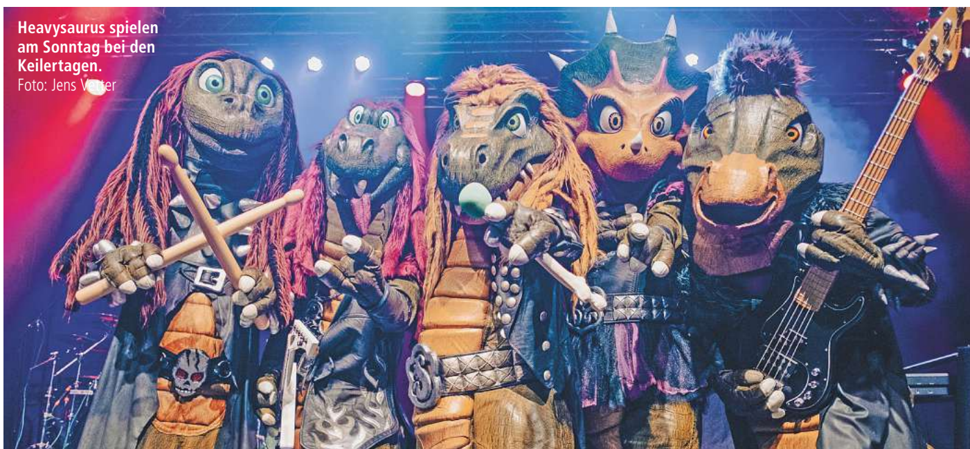
Heavysaurus spielen am Sonntag bei den Keilertagen.