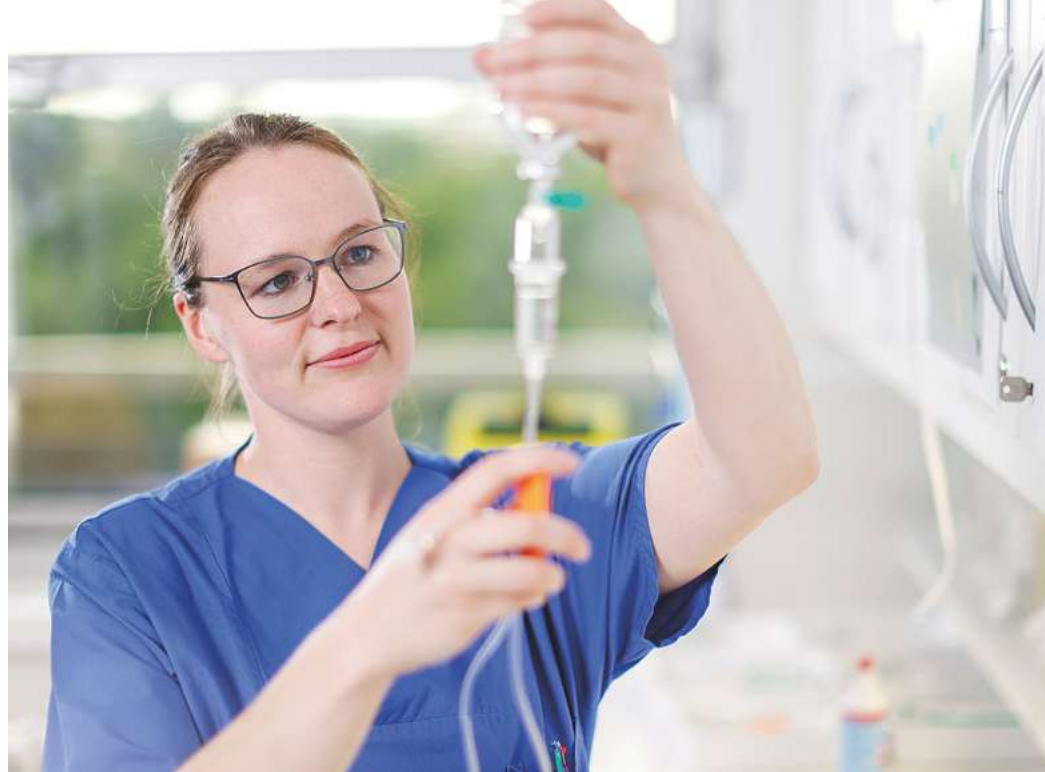
Der Studiengang „Praxisorientierte Pflegewissenschaft“ vereint Pflegewissenschaft und Spezialwissen mit dem Ziel die Pflegequalität zu verbessern. Nähere Infos bei www.umg.eu/studium-lehre/studieren-an-der-umg/studiengaenge/praxisorientierte-pflegewissenschaft