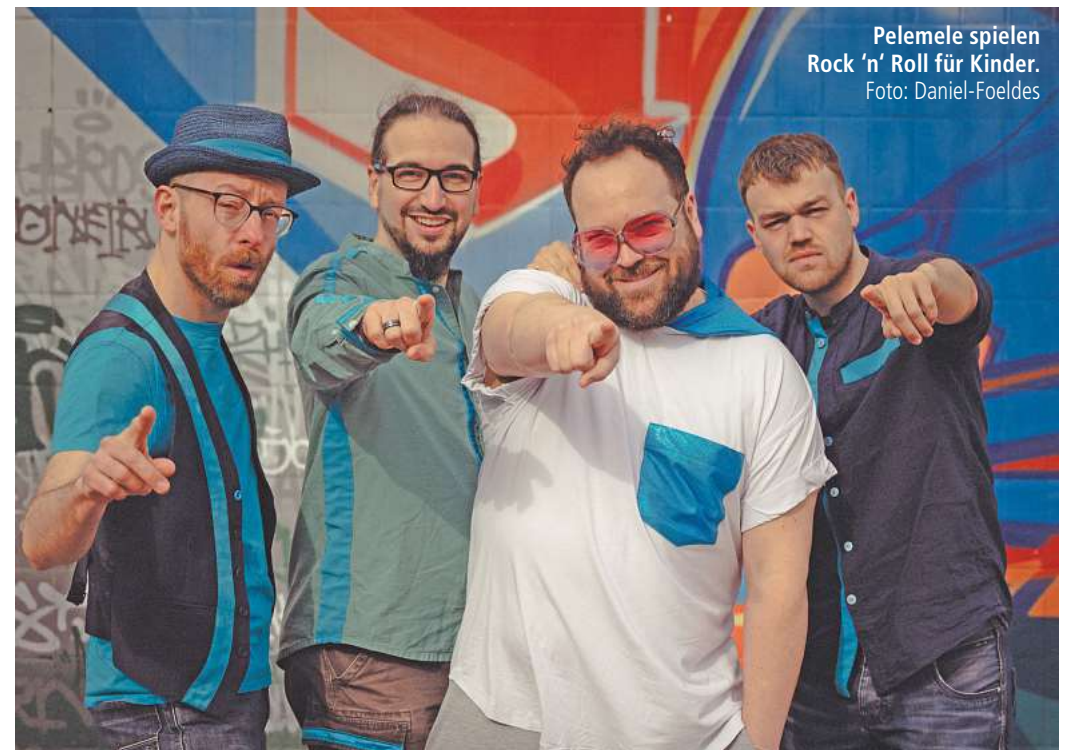
Pelemele spielen Rock 'n' Roll für Kinder.