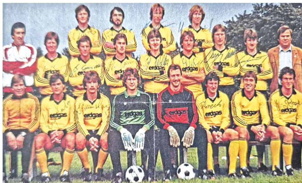
Das Team der 2. Liga Nord 80/81.