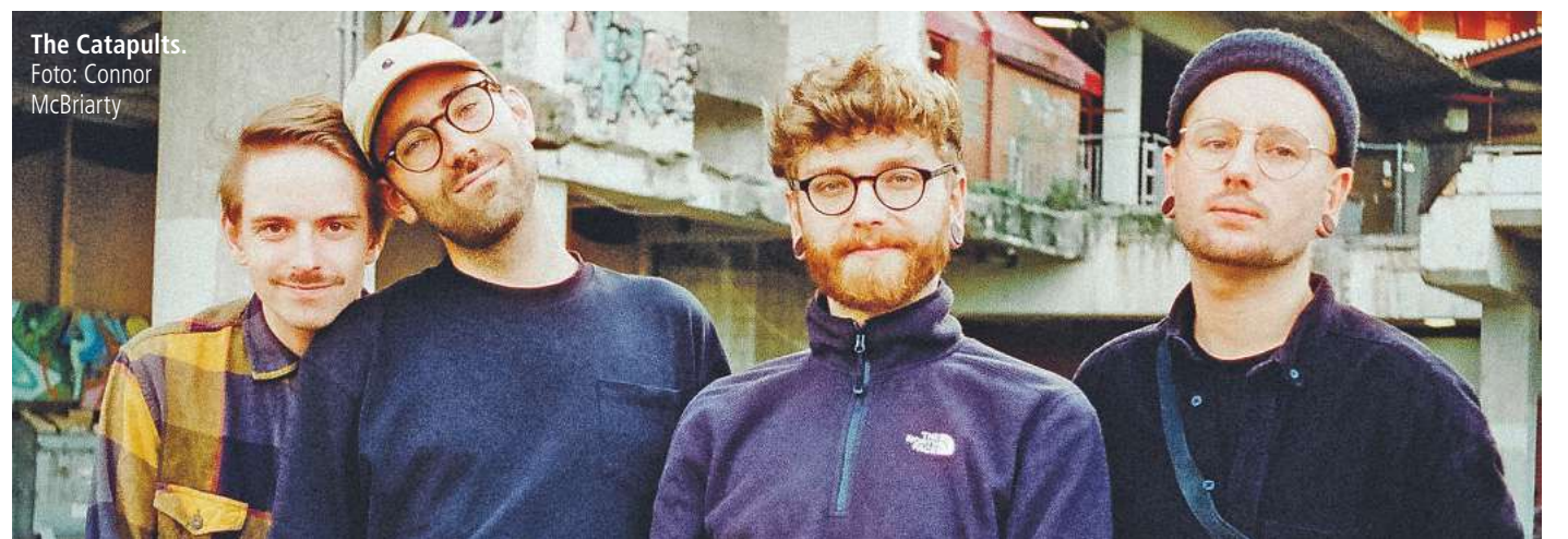
The Catapults.

Gemeinsam mit vielen weiteren Unterstützern – darunter das Einbecker Brauhaus, Metallbau Senge, die Allianz Philipp Thode, die Sparkasse Göttingen, das Seniorenzentrum Göttingen, Annette Tubbesing-Büsterfeld, CUBUS Immobilien GmbH, die Tischlerei Welling, HKS Sicherheit, REW Gutachten, das Göttinger Tageblatt sowie Rös-