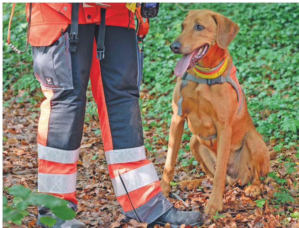
Rettunghundestaffel der Johanniter im Übungseinsatz: Rettungshund Kasper wartet bei der Rettungshundeführerin.