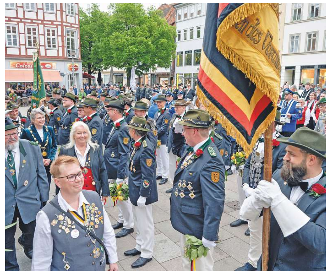
Auch in diesem Jahr versammeln sich die Schützenvereine wieder vor dem Alten Rathaus.

Während des Festes wird ein Vergnügungspark mit rund 20 Ständen die Besucher unterhalten – darunter ein Riesenrad mit 20 Metern Durchmesser, Autoscooter, die Krake, ein Irrgarten, eine Geisterbahn zum Durchlaufen und auch ein Kinderkarussell. Kulinarisch wird alles von Zuckerwatte bis Bratwurst dabei sein – und der „Malzwirt“ hat Krustenbraten im Brötchen mit einer selbst entwickelten Malz-Soße im Angebot. Mit „Jetzt schlägt's 13“ startet am Donnerstag, 19. Juni, das musikalische Programm mit Rock 'n' Roll-Klassikern, Pop und Rock. Auf der Bühne stehen Schauspielerinnen