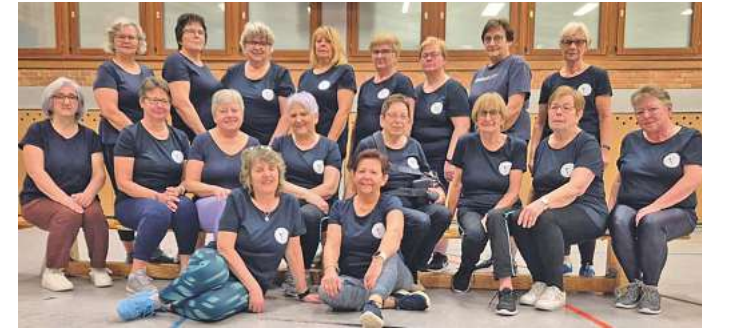
Oben: Die Frauen-Gymnastik-Gruppe des TSV Adelebsen feiert in diesem Jahr ihr 60-jähriges Bestehen. Die Herren-Gymnastik-Gruppe des TSV Adelebsen bei einer Einheit in der kleinen Adelebser Sporthalle.

Der TSV hatte zu seinen besten Zeiten knapp 1.000 Mitglieder, aktuell sind es etwa 600. In dem Verein mit den Farben Blau-Weiß gibt es neben Fußball auch viele Angebote im Bereich Gymnastik, darunter Damen- und Herrengymnastik, Aerobic sowie „Rücken fit“. Weitere Sportarten, die man hier betreiben kann, sind unter anderem