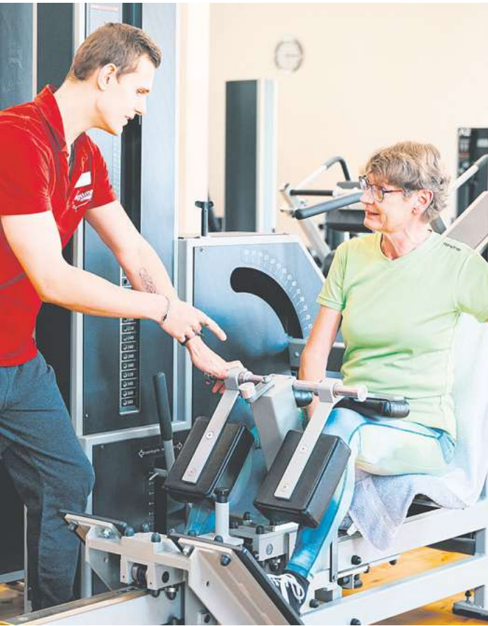
– Anzeige –

• Individuelle Trainingsprogramme und persönliche Begleitung • Medizinische Trainingsberatung • Rücken- und Beweglichkeitskurse in Kleingruppen • Beckenbodentraining am Gerät • InBody-Messung der Körperzusammensetzung KONTAKT Optimed Training Maschmühlenweg 93 37081 Göttingen Tel.: 0551 / 79 76 60 E-Mail: goettingen@optimed-training.de Geöffnet Mo. bis Fr. 7.30 bis 20.30 Uhr Sa. 10 bis 16 Uhr So. 9 bis 18 Uhr