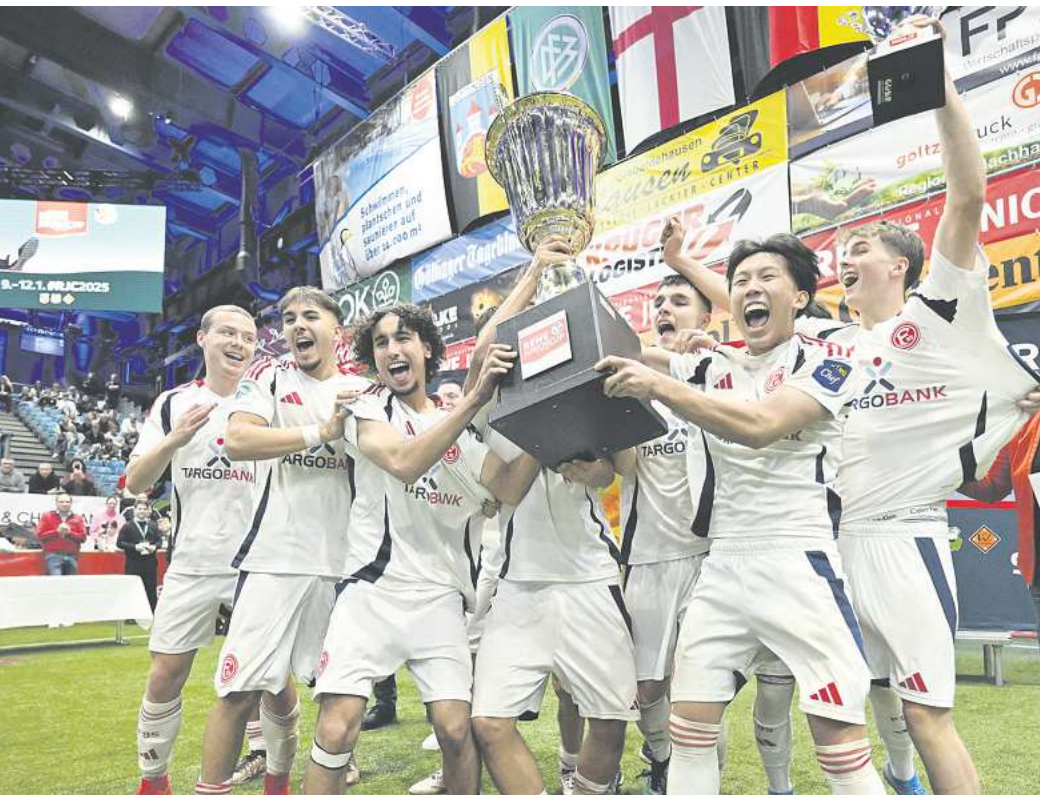
Im vergangenen Jahr holte sich der Nachwuchs von Fortuna Düsseldorf den REWE Juniorcup. Das Team will den Titel verteidigen.