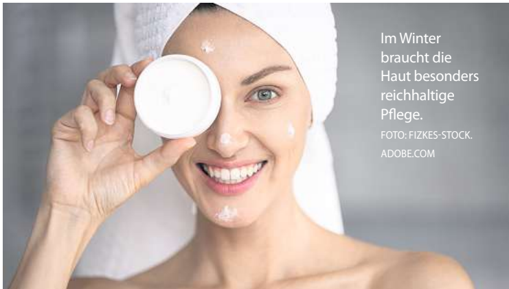
Im Winter braucht die Haut besonders reichhaltige Pflege.

3. Sonnenschutz: Schnee reflektiert die Sonnenstrahlen selbst bei bedecktem Himmel. „Sonnencreme enthält oftmals zu wenige Lipide