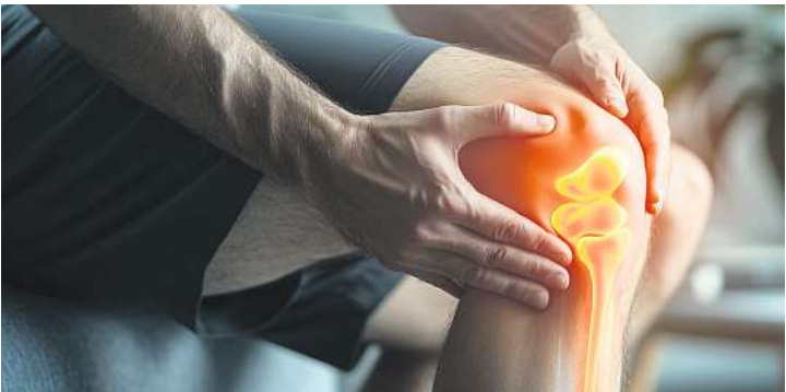
Bewegung, Gewichtsreduktion und eine individuell angepasste Therapie können bei Kniearthrose helfen.

Sie möchten Ihr Unternehmen auf dieser monatlich erscheinenden Sonderseite präsentieren? Kontaktieren Sie uns, wir beraten Sie gern: Telefon 05 51 / 901-483 E-Mail s.schwarzburger@goettinger-tageblatt.de