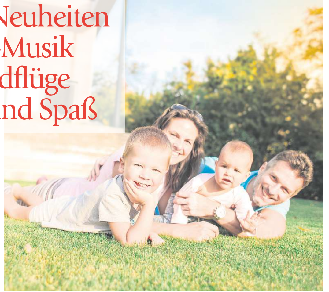
Die Frühlingsmesse bei Holzland Hasselbach präsentiert alles für Garten, Haus und Freizeit – mit vielen Messe-Schnäppchen.

Messe-Neuheiten Live-Musik Rundflüge Spiel und Spaß