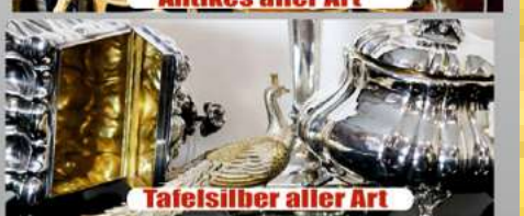
Tafelsilber aller Art

Kostenlose Begutachtung und Bewertung Ihres Schmuckstücks (auch bei Ihnen zu Hause)