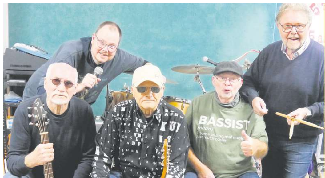
Am heutigen Samstag um 19 Uhr beginnt die 9. Göttinger Oldie Night. Vier Live-Bands stehen dabei auf der Bühne der Musa: 5 about 40 (Foto), Die Allstars, Boom und die Hot Docs. Das gesamte Obergeschoss der Musa wird zum „Rock-Tempel“ mit viel Platz zum Tanzen, für Gespräche und Genuss. Und es gibt auch eine Probenbühne.

• Im Museum im Ritterhaus Osterode ist bis 26. April die Fotoausstellung „HarzNatur 2025“ zu sehen: Dienstag bis Freitag von 10 bis 13 Uhr und von 14 bis 17 Uhr. Samstag, Sonntag und an Feiertagen von 14 bis 17 Uhr.