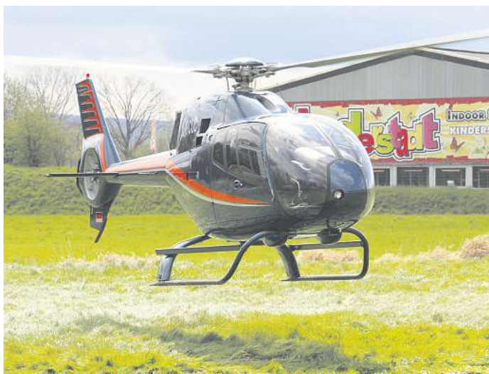
Auch Hubschrauber-Rundflüge werden wieder angeboten.

die Welt mal von oben sehen. Für das leibliche Wohl ist an beiden Tagen bestens gesorgt, von Gegrilltem bis zum Kuchenbuffet wird für jeden etwas dabei sein. Live-Musik gibt es beim Frühlings-Sonntag am Sonntag ab 12 Uhr. „Die Eichenberger“ machen gute Laune mit ihrem großen Repertoire von modernen Stimmungshits bis zur Polka.