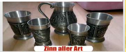
Zinn aller Art

*in Verbindung mit Gold Wir zahlen bis zu 8.500 € für Ihren Pelz*