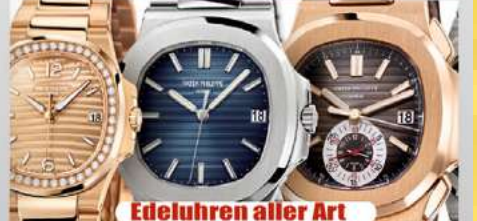
Edeluhren aller Art

Ihre Vorteile: ✓ kostenlose Beratung ✓ kostenlose Wertschätzung ✓ transparente Abwicklung ✓ Bargeld sofort