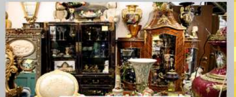
Antikes aller Art