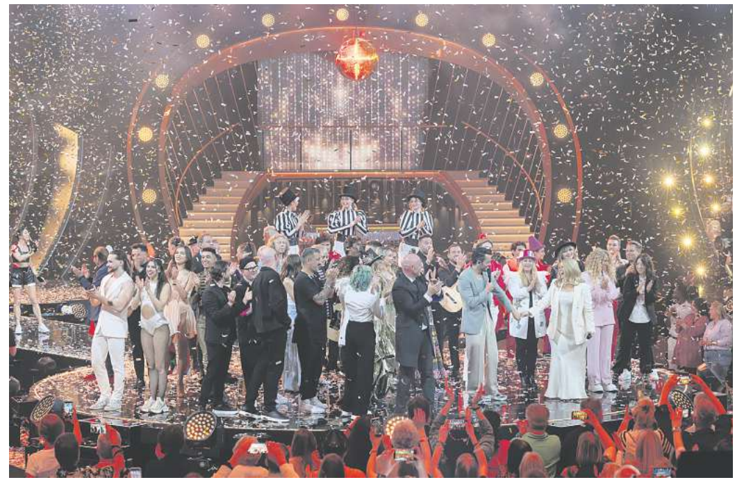
Die Giovanni Zarrella Show „Party pur“ live aus Göttingen sahen rund drei Millionen Menschen.