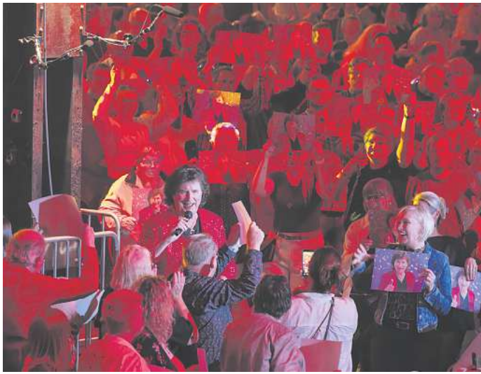
Olaf der Flipper beim Bad in der Menge in der Lokhalle.