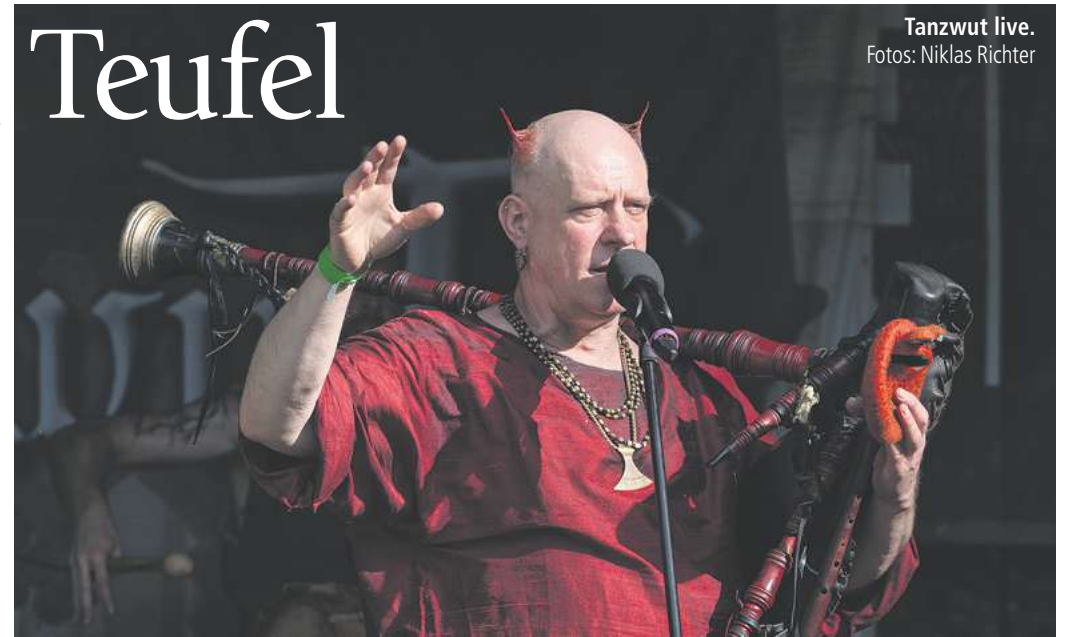
Tanzwut live.

Joachim Witt, der Headliner am Samstag, wurde in den 80ern mit „Goldener Reiter“ berühmt und ist seit vielen Jahren im düsteren Rock- und Pop-Genre erfolgreich – unter anderem mit „Die Flut“ zusammen mit Peter Heppner, der auch im Schloss-