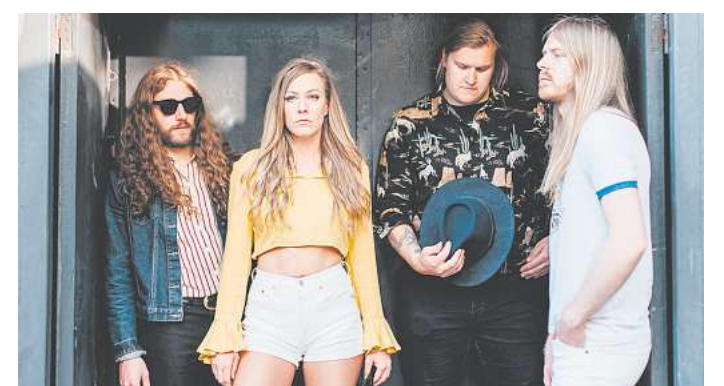
Die schwedischen Blues-Hardrocker Blues Pills.

Headliner am Festivalamstag ist die schwedische Band Blues Pills, die mit ihrer Mischung aus Hardrock und Soul seit Jahren international für Furore sorgt. Sängerin Elin Larssonas und Kollegen sind vor allem für ihre mitreißenden Liveauftritte bekannt. Dazu stößt das britisch-amerikanische Duo Young Gun Silver Fox, das modernen