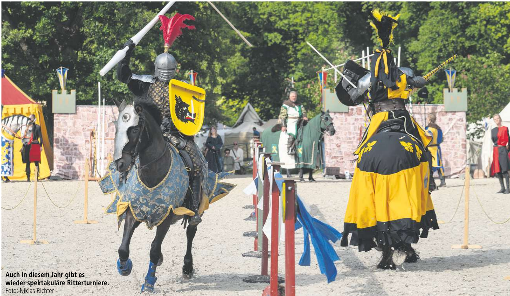
Auch in diesem Jahr gibt es wieder spektakuläre Ritterturniere.

Dieses Jahr gibt es wieder ein Open Air im KWP. Im Stadtwald rocken unter anderem die Blues Pills (Foto: Sängerin Elin Larsson). Informationen zu Live-Acts und Vorverkauf gibt es auf SEITE 9