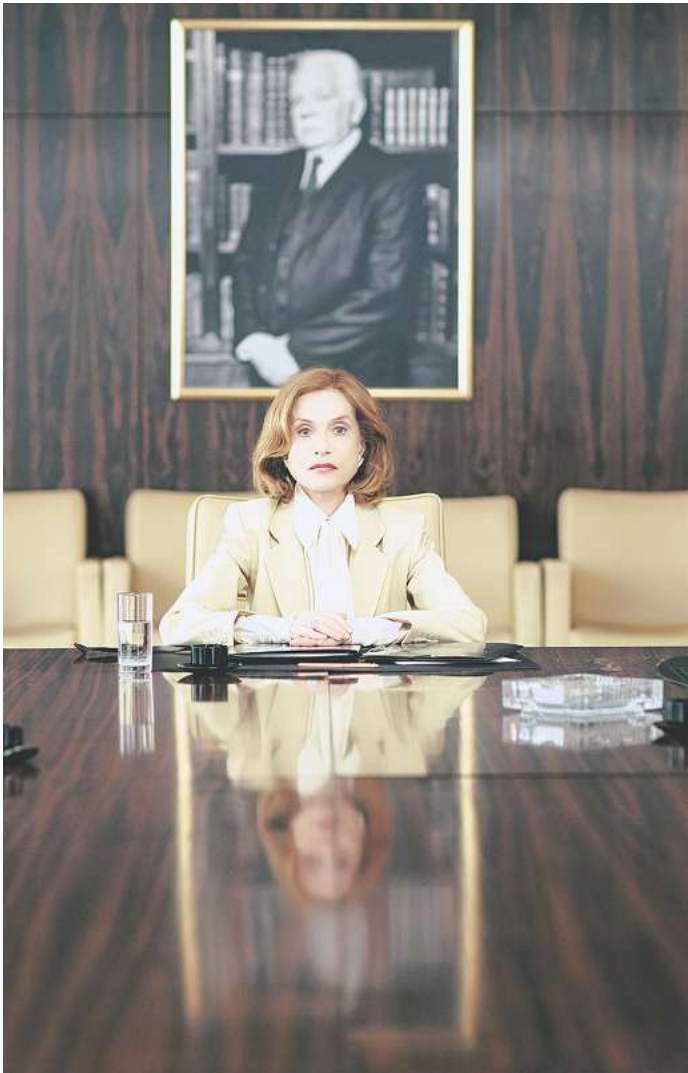
An oberster Spitze: Marianne Farrère (Isabelle Huppert) ist Geschäftsfrau durch und durch. In „Die reichste Frau der Welt“ (läuft im Kino Méliès) begegnet sie einem Fotografen und es ist Liebe auf den ersten Blick. Mit kreativer Boshaftigkeit nistet der sich ein – in den altherwürdigen Machtstrukturen der Familie und ihrem grenzenlosen Luxus. Doch da ist auch noch eine Tochter, die um ihr Erbe, die Familie und die Liebe ihrer Mutter kämpft. Und ein Butler, der mehr weiß als er sagt ...

Kino Lumière: 15.00 Mein Freund Barry, 17.15 Der Astronaut - Project Hail Mary, 20.15 Als wäre es leicht Méliès: 15.00 Gelbe Briefe, 17.30 Vier minus Drei, 20.00 Die reichste Frau der Welt Live-Musik/Party 14.00 und 16.00 Waldorfschule Göttingen: Göttinger Sinfonieorchester, Die vier Jahreszeiten Theater 15.00 DT: Kati will Großvater werden 15.00 JT: Die drei ??? Kids - Zirkus der Rätsel 16.00 Theater der Nacht, Northeim: Der Rattendämon Sonstiges/Ausflug 7.30-16.00 Kauf Park Göttingen: Flohmarkt