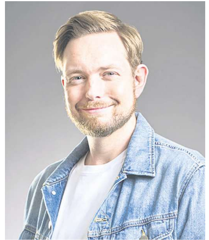
Bastian Bielendorfer ist am 8. Mai in der Göttinger Stadthalle.

Kino Lumière: 15.00 Mein Freund Barry, 19.30 Was bleibt? - Das Auslandsjahr in meinem Leben (OmU) Méliès: 15.00 Maschenkino, Die reichste Frau der Welt, 17.30 Die reichste Frau der Welt, 20.00 Rose Live-Musik/Party 19.00 Mehrzweckhalle Grone: Leinen Los! - Konzert des Shanty-Chors der Marinekameradschaft Göttingen 19.30 Kleinkunsthalle Geismar: MarieÖlac (Western- und Rocksongs) 19.30 PS Speicher Einbeck: Göttinger Sinfonieorchester, Mystisch 19.30 Eichsfelder Kulturhaus, Heiligenstadt: Cinderella, das 80er Musical 20.00 Stadthalle Göttingen: Glenn Miller Orchestra, Swing forever 20.00 Alpenmax: Mama geht tanzen / Muttertag 20.15 Apex: Sparkling Souls, Soulful Jazz Music 21.00 Nörgelbuff: Club Mundial mit DJ Ringo 22.00 Exil: Depeche Mode Party 23.00 Musa: Pfeffer + Salz (Clubnacht) 23.00 EinsB: Ü30-Party Theater 19.30 Gesamtschule Moringen: Die Geierwally, Bürgertheater 19.45 DT: Altbau in zentraler Lage 20.00 DT: Doping 20.00 JZ: Being Lou Andreas-Salomé (Premiere) 20.00 Theater der Nacht, Northeim: Herzogsglück & Kaiser-schmarren Sonstiges/Ausflug 10.00-18.00 Duderstadt, Innenstadt: Gartenmarkt, Geschäfte geöffnet bis 17 Uhr 16.00 Stadtbibliothek Göttingen: Gratis-Comic-Tag 11.00 ab Gäste-Info Duderstadt: Unterwegs mit Marktfrau Mariken (Stadtführung) 11.30 und 15.00 ab Tourist Info Göttingen: Rund ums Gänseliesel, 13.00 Kunst in der Stadt (Stadtführungen) 11.45 Stadtbibliothek Göttingen: Wissen vor 12