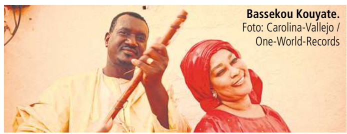
Bassekou Kouyate.