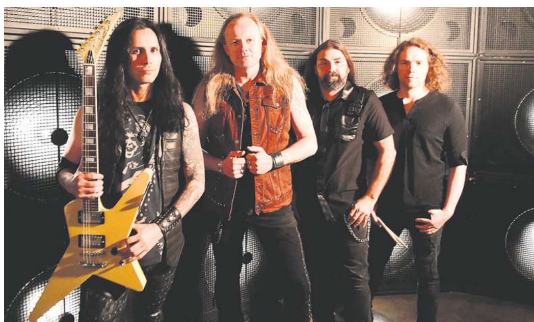
Headliner des Festivals sind Firewind, die Powermetal-Band von Gitarrist Gus G (l.), der unter anderem schon für Ozzy Osbourne und Arch Enemy spielte.

Für das Nuts4Rock-Open Air können unsere Leser dreimal zwei Tickets gewinnen. Wer mitmachen möchte, kann das ab sofort tun bei Instagram @extratip_goettingen (QR-Code) tun. STAR