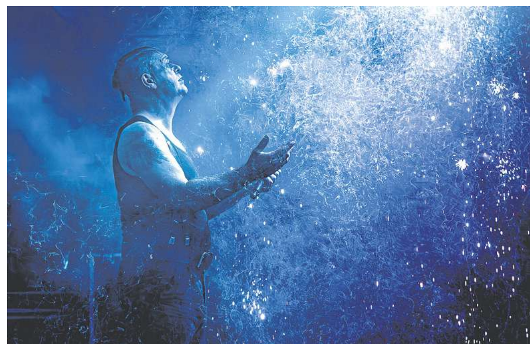
Am Samstag, 30. Mai, um 20 Uhr kommt mit Stahlzeit eine der aufwendigsten Tributeshows in die Probonio Arena Kassel (Eissporthalle). Die Band tourt seit über 20 Jahren durch Europa und begeistert mit der Musik von Rammstein und einer Show, die dem Original schon sehr nahe kommt. Versprochen sind „Hitze, Sound und Emotionen“.

Am 30. Mai wird im Kauf Park „Kunst in der Regoin“ eröffnet mit Kinderschminken und Luftballonmodellage. Bis 31. Mai hat im Forum Wissen „Sammlungen erzählen. Und wie sammelst du?“ geöffnet. Bis zum 31. Mai ist im Archäologischen Institut in Göttingen im Nikolausberger Weg 15 „hautnah. Die farbigen Bronzestatuen der Griechen“ zu sehen. Geöffnet ist die Schau sonntags von 11 bis 16 Uhr. Bis September wird im Städtischen Museum Göttingen am Ritterplan die Sonderausstellung „Ab aufs Rad!“ zu sehen sein. Geöffnet Dienstag bis Freitag von 10 bis 17 Uhr, Samstag und Sonntag 11 bis 17 Uhr. An jedem ersten Donnerstag im Monat ist bis 19 Uhr geöffnet.