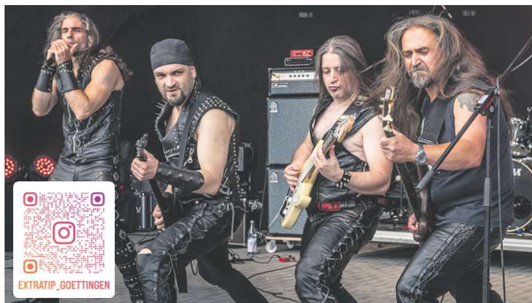
Die Fans wird's freuen, dass Manomore in diesem Jahr wieder mal dabei sind. Sie rocken mit den Hits von Manowar die Festivalbühne.