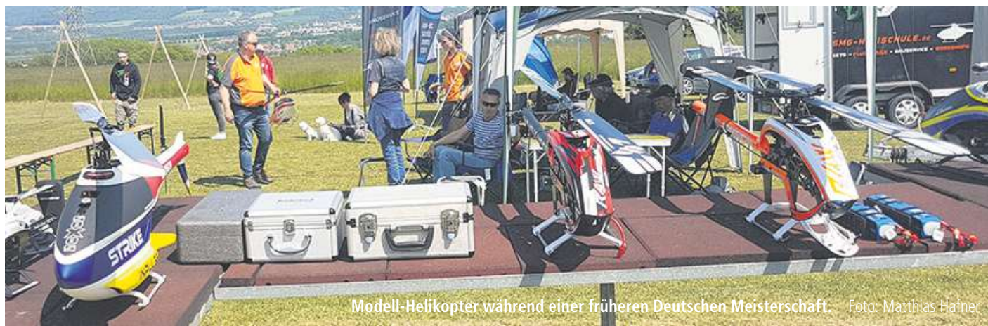
Modell-Helikopter während einer früheren Deutschen Meisterschaft.