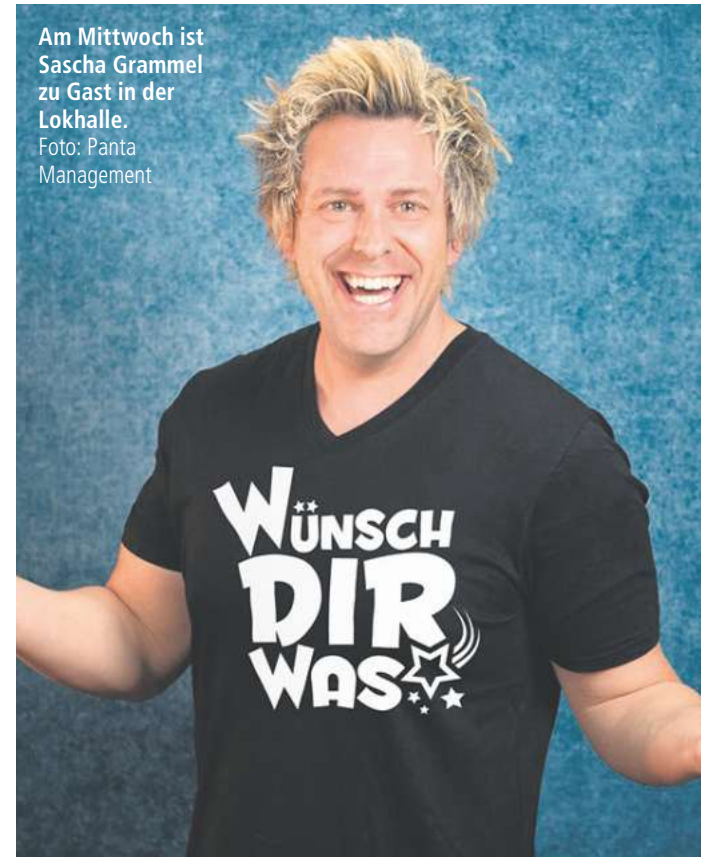
Am Mittwoch ist Sascha Grammel zu Gast in der Lokhalle.

Kino Lumière: 17.30 Father Mother Sister Brother, 20.00 Nürnberg Méliès: 17.30 Exhibition on Screen - Caravaggio (OmU), 20.00 Vivaldi und ich Live-Musik/Party 11.00 Symphonic Space, Prinzenstraße 9: Kontrabass! (Kammerkonzert, GSO) 15.30 Apex: New Orleans Syncoptators, Lazy Saturday Afternoon 19.00 Stadthalle Göttingen: K-Pop Showdown (Tribute-Show) 19.00 St. Vitus Kirche Erbsen: Duo Celtic Breath (Keltische Harfe und Saxophon) 19.00 St. Paulus Göttingen: Petrichor Weende und Solisten, Petite Messe Solenelle von Rossini 20.00 Eissporthalle Kassel: Stahlzeit (Rammstein-Tribute-Show) 20.00 Northheim: Musiknacht, Programmflyer online bei www.city-center-northheim.de 20.00 Exil: #wirsinddienacht - Rock'n'Rollstuhl Special (Rock, Pop, Indie,...) 20.00 Kulturbahnhof Uslar: Karaoke-Abend 21.00 Musa: 40+Beatz - Tanzvergnügen für Erwachsene 22.00 Alpenmax: Schillamann 6 23.00 Savoy: Funky Pussy Club Theater/Kabarett 15.00 JT, Bühne im Hof: Pippi Langstrumpf 19.45 DT: The Rocky Horror Show 20.00 JT: Kopenhagen