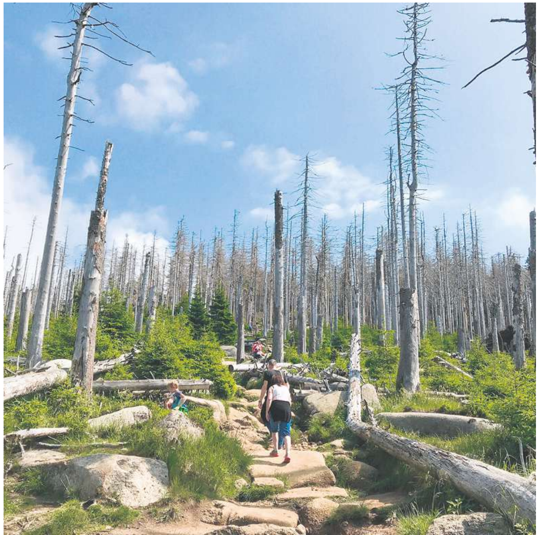
In der neu gestalteten Ausstellung geht es auch um die Zukunft des Walds im Harz.

Die neuen Angebote in und um das NBZ sollen den vielen Gästen ohne umfangreiche Vorkenntnisse die wichtigsten Ziele, Aufgaben und Lebensräume des Nationalparks auf informative und unterhaltsame Weise vorstellen. Drängende Fragen etwa zur Vergangenheit und Zukunft des Waldes, zu Totholz und der Baumart Fichte werden den Besuchenden in vielen interaktiven Elementen spielerisch beantwortet. Ein weiteres Thema ist das Wasser, das im Harz eine zentrale Rolle spielt. Ganz besonders für das Große Torfhausmoor, das als eines der besterhaltenen Moore in Deutschland einen prominenten Platz in den Projekten einnimmt. So widmet sich die obere Etage der Ausstellung voll und ganz diesem Lebensraum, zwei Wildnis-Entdeckerstationen informieren im Außenbereich über Ökologie und Schutzansätze. Dabei wurde auf eine ausgewogene Mischung aus digitalen und analogen Medien geachtet. MUNDS