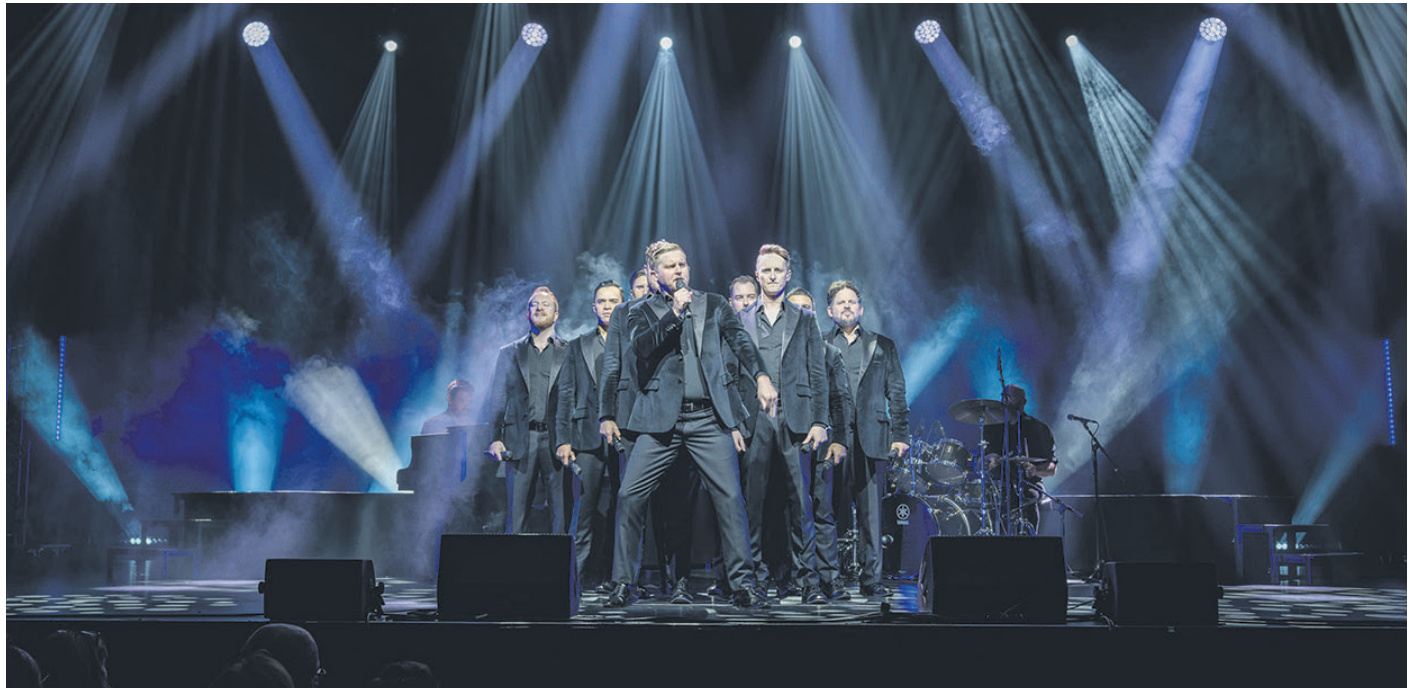
Zehn Tenöre machen mächtig Stimmung: The Tenors sind auf „Time of our Life“-Tour und singen am Mittwoch, 3. Juni, um 20 Uhr in der Stadthalle Göttingen bekannte Melodien aus Opern, Operetten, Rock und Pop. Es gibt noch Karten an der Abendkasse.

Sonstiges 14.00-21.00 Sportzentrum der Universität: Dies Academicus