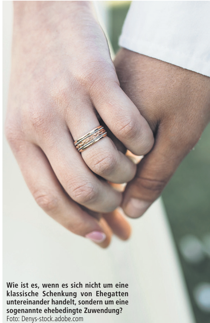
Wie ist es, wenn es sich nicht um eine klassische Schenkung von Ehegatten untereinander handelt, sondern um eine sogenannte ehebedingte Zuwendung?

Wir wollen uns vielmehr mit Zuwendungen unter Eheleuten befassen. Schenkungen unter Eheleuten fallen unabhängig vom Zeitpunkt, wann sie ausgereicht wurden, in voller Höhe unter die Pflichtteilsansprüche. Das liegt daran, dass die Abschmelzung, also die Zehnjahresfrist, innerhalb derer der Pflichtteilsanspruch sich reduziert, wenn die Schenkung in der Vergangenheit getätigt wurde, bei Schenkungen unter Eheleuten nicht relevant ist. Der Gesetzgeber geht davon aus, dass der Schenkende bei einer Schenkung an den Ehegatten immer noch in gewisser Weise an der Schenkung partizipiert, da sie ja das Familienvermögen