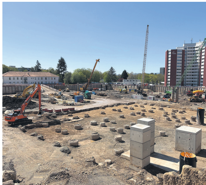
Blick auf das Baufeld von NI-KO: Alle 657 Stahlbetonpfähle wurden planmäßig in den Boden eingebracht.

GÖTTINGEN. Die Arbeiten zur Tiefgründung des Neubaus NI-KO der Universitätsmedizin Göttingen (UMG) sind erfolgreich abgeschlossen. NI-KO steht für Notaufnahme, Intensivmedizin, Krankenpflege und Operationszentrum.