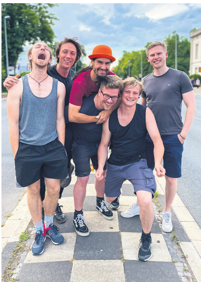
Ska total am Freitag, 5. Juni, im Exil: Wisecracker feiern ab 20 Uhr „30 Jahre Lärm und Liebe“ und sie tun das gemeinsam mit den Göttinger Ska-Experten von Merry-go-round (Foto), die Songs aus ihrem neuen Album spielen werden.

• Bis September wird im Städtischen Museum Göttingen am Ritterplan die Sonderausstellung „Ab aufs Rad!“ zu sehen sein. Geöffnet Dienstag bis Freitag von 10 bis 17 Uhr, Samstag und Sonntag 11 bis 17 Uhr. An jedem ersten Donnerstag im Monat ist bis 19 Uhr geöffnet.