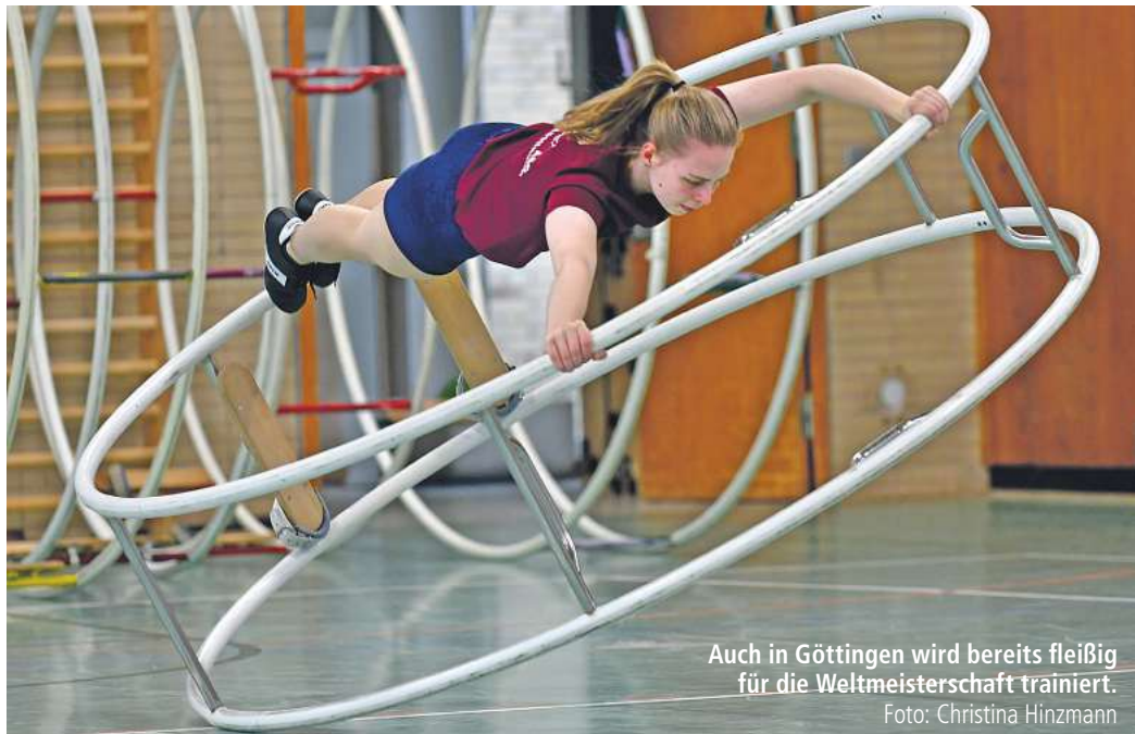
Auch in Göttingen wird bereits fleißig für die Weltmeisterschaft trainiert.

Für Finnland ist die erste Teilnahme zudem mit einer besonderen Geschichte verbunden: Die einzige finnische Athletin lebt und trainiert in Göttingen, sie hat bei der Weltmeisterschaft also ein Heimspiel.