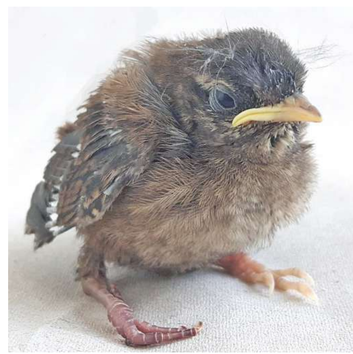
Bei Hilfebedarf vermittelt die App zügig die richtigen Ansprechpartner wie Wildtierstationen, Veterinärkliniken, zuständige Behörden sowie Polizei und Feuerwehr in der Region.

Aktuell umfasst die Datenbank nach seinen Angaben die etwa 100 in Deutschland am häufigsten vorkommenden Wildtierarten, was knapp 95 Prozent der anfallenden Fälle abdeckt. Dazu kommen mehr als 4.000 bundesweit verteilte Notfallkontakte. Pees: „Ziel ist eine deutliche Erweiterung beider