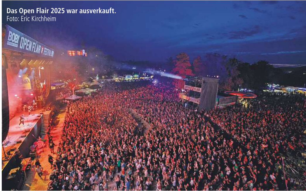
Das Open Flair 2025 war ausverkauft.

REGION. 20.000 Besucherinnen und Besucher, rund 100 Bands an fünf Tagen, dazu Kabarett im Schlosspark, Poetry-Slam im E-Werk, Kinderprogramm und Walkacts – das Open Flair Festival verspricht wieder ein echtes Erlebnis zu werden. Vom 5. bis 9. August findet das Eschweger Open Air in diesem Jahr statt. Tickets gibt es noch im Vorverkauf online bei shop.open-flair.de . Wir verlosen zwei Tickets plus Camping.