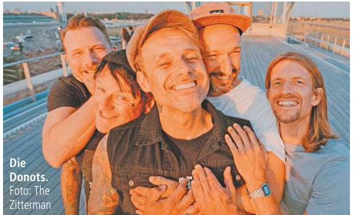
Die Donots.