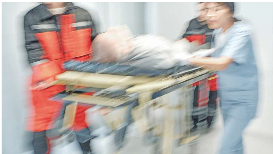
Ein Unfall führt leider nicht selten zu einer Invalidität. Man muss einiges beachten und erledigen, um sich Ansprüche aus einer privaten Unfallversicherung zu sichern.

Gegenüber seinem Unfallversicherer anspruchsberechtigt, ihm gegenüber aber auch verpflichtet, bestimmte Obliegenheiten zu erfüllen, ist allein der Versicherungsnehmer und nicht eine sogenannte versicherte Person, auch wenn sie den Unfall erlitten hat. Lediglich versicherte Personen können bei-