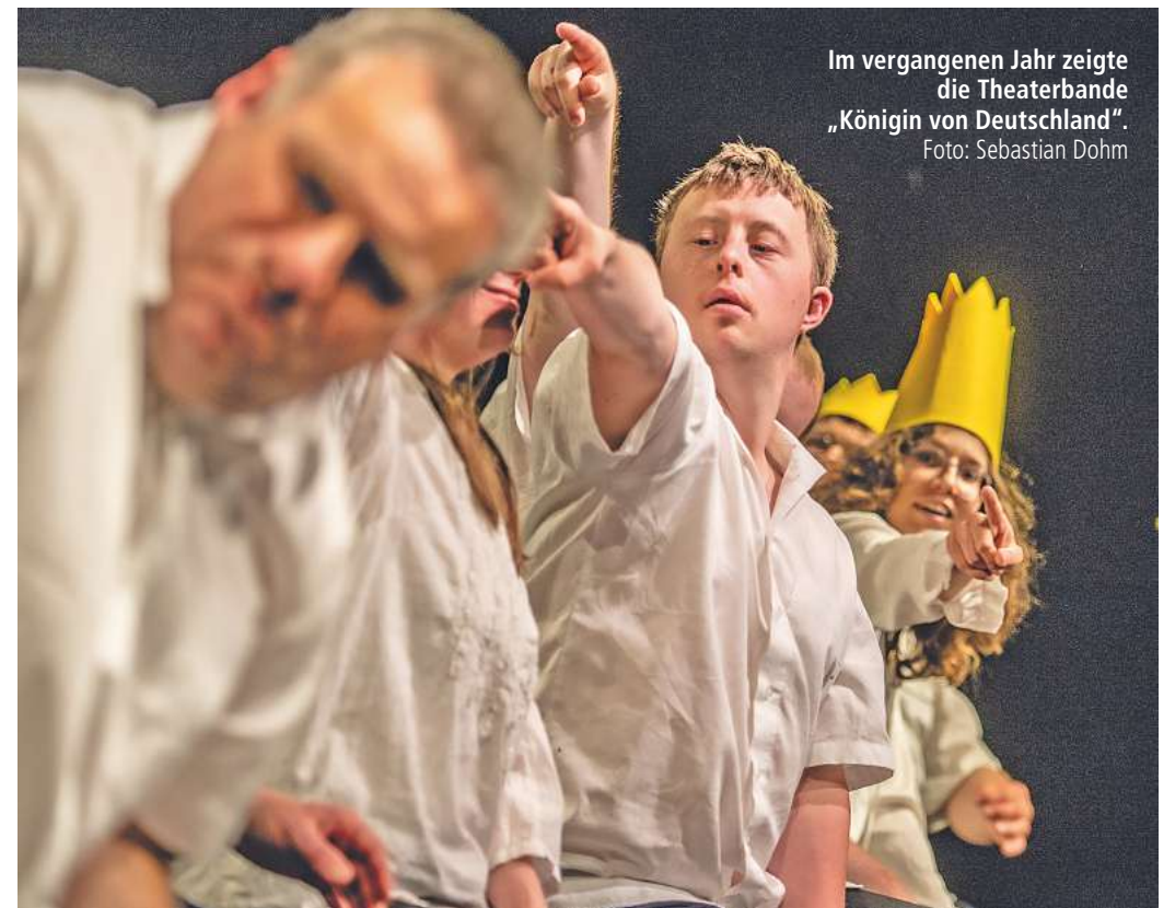
Im vergangenen Jahr zeigte die Theaterbande „Königin von Deutschland“.

Weitere Informationen zum inklusiven Theaterfestival gibt es unter www.boatpeopleprojekt.de , Tickets gibt es online unter reserviv.de , bei allen bekannten Vorverkaufsstellen sowie direkt an der Tageskasse. Die Tickets gelten für jeweils einen ganzen Festivaltag. Der Eintritt erfolgt über einen Solidaritätsbeitrag. Das heißt, es werden zwei verschiedene Preiskategorien angeboten, zwischen denen frei gewählt werden kann (fünf oder acht Euro). STAR