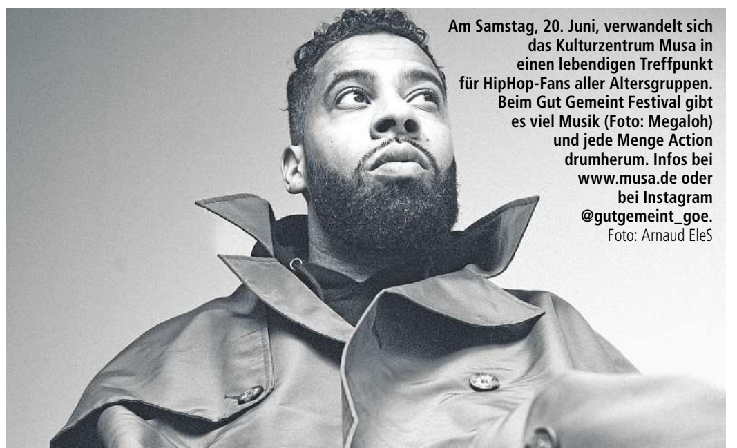
Am Samstag, 20. Juni, verwandelt sich das Kulturzentrum Musa in einen lebendigen Treffpunkt für HipHop-Fans aller Altersgruppen. Beim Gut Gemeint Festival gibt es viel Musik (Foto: Megaloh) und jede Menge Action drumherum. Infos bei www.musa.de oder bei Instagram @gutgemeint_goe . Foto: Arnaud EleS

Kino Méliès: 17.30 Glennkill: Ein Schafskrimi, 20.00 Der Teufel trägt Prada 2