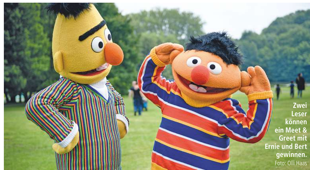
Zwei Leser können ein Meet & Greet mit Ernie und Bert gewinnen.

Das 20 mal sechs Meter große Kanubecken, in dem gleichzeitig mehrere Personen in Kanubooten und auf Stand-up-Paddles fahren können, war in den vergangenen Jahren ein echter Publikumsmagnet des Aktionstages. Auch in diesem Jahr werden der Turn- und Wassersportverein Göttingen von 1861 und der Göttinger Paddler-Club das Wasserbecken aufbauen. Ebenfalls mit Kanus unterwegs sind Besucher bei der Vereinigung Göttinger Faltbootfahrer: In Kanus sitzend, können Kinder hier eine Rutsche herunterrutschen. Viele sportliche Aktivitäten sind bei „Schule, aber sicher!“ geplant. Mehrere Ballsportarten sind auf der Wiese des Jahnstadions vertreten. Minigolf (1. Miniatur-Golfclub 1970), Beachtennis (Tennisverband Niedersachsen Bremen), Discgolf (Sportjugend Göttingen), Hockey (HC Göttingen) und Fußball sind nur ein paar der Sportarten, die Besucher ausprobieren und kennenlernen können. Zudem können sie beim Fußballdarts vom SC Hain-