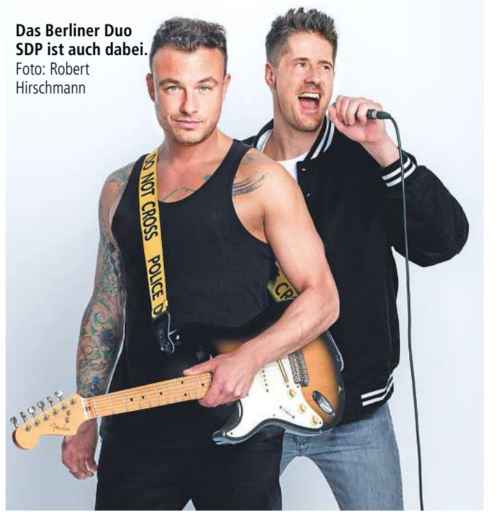
Das Berliner Duo SDP ist auch dabei.