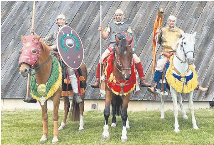
Am 20. und 21. Juni ist Römerfest am Harzhorn. Alle Besucherinfos findet man online bei www.roemerschlachtamharzhorn.de .