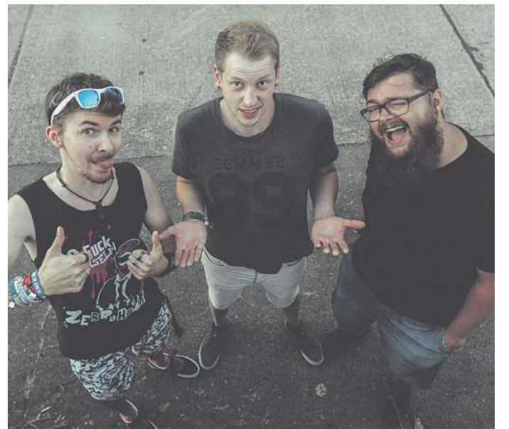
Zwei Tage lang ist im LNS-Park in Duderstadt Open Air. Am 27. Juni spielen unter anderem Jungfrau Männlich Deluxe. Alle Infos zum Festival bei www.kultursommer-duderstadt.de.