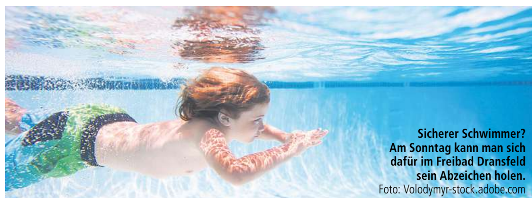
Sicherer Schwimmer? Am Sonntag kann man sich dafür im Freibad Dransfeld sein Abzeichen holen.

haben, auch längere Strecken zu meistern, und sich auch in ungewohnten Situationen problemlos orientieren zu können“, erklärt Christian Landsberg, Präsident des Bundesverbandes zur Förderung der Schwimmbildung. Das Deutsche Schwimmabzeichen Bronze stehe für grundlegende Sicherheit im Wasser. Die Schwimmabzeichen Silber und Gold bauen darauf auf und stellen höhere Anforderungen an Ausdauer, Technik und Sicherheit. Das Seepferdchen bildet für viele Kinder den Einstieg in das Schwimmenlernen und vermittelt wichtige Grundlagen für den sicheren Aufenthalt im Wasser. STAR